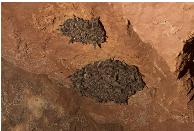
Fig. 3. Agrupació col·lectiva d'hivernal de Miniopterus schreibersii en la illa de Menorca.

Solament Myotis escalerae presenta un important nombre de colònies integrades per elevats efectius. El rest de les espècies, que