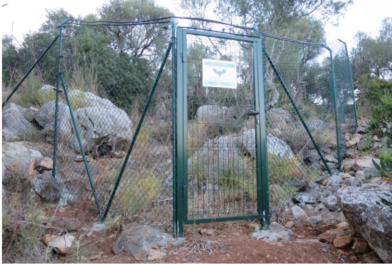
Fig. 2. Vallado perifèric instal·lat en 2014 en un refugi de murcièl·lago en Mallorca.