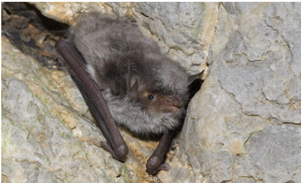
Fig. 4. Ejemplar adulto de Myotis capaccinii en una cavidad de Mallorca.

presentan un marcado comportamiento gregario, se encuentran restringidas a unas pocas colonias en Mallorca y Menorca, y las estimas de sus efectivos no superan, en la mayoría de los casos, el millar de individuos. La situación de varias especies es preocupante, debido, especialmente, a los escasos efectivos con los que cuentan algunas de ellas, especialmente Rhinolophus ferrumequinum y Myotis emarginatus que tienen en unas escasas colonias de Menorca su principal bastión. En el caso de Myotis capaccinii y Miniopterus schreibersii la casi totalidad de sus efectivos se encuentran en dos cavidades marinas descubiertas recientemente.