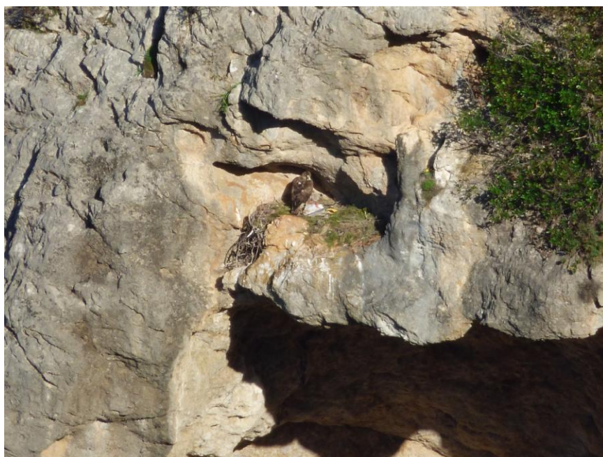
Foto 5: Vista del nido de águila de Bonelli donde se ha instalado una pareja, en su primer año de reproducción en 2014. Pegado al fondo del nido se puede apreciar el pollo que criaron, y el aporte de gaviota patiamarilla ( Larus michahellis ) como presa con la que cebarlo.

Aparte de los dos volantes muertos en 2013 ya mencionados, las causas de mortalidad hasta el momento están relacionadas únicamente con la electrocución, que ha causado cuatro bajas entre ejemplares de primer año durante la fase de dispersión. Respecto a los ejemplares liberados mediante aclimatación, ha habido dos bajas, una por inadaptación, en la que hubo que recoger al águila que murió durante su rehabilitación, y otra por razones desconocidas ya que cayó al mar y no se pudo practicar la necropsia.