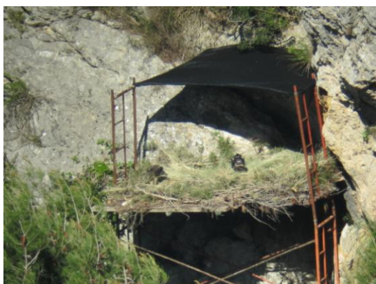
Foto 1: Nido artificial del hacking abierto utilizado en 2011 y 2012.