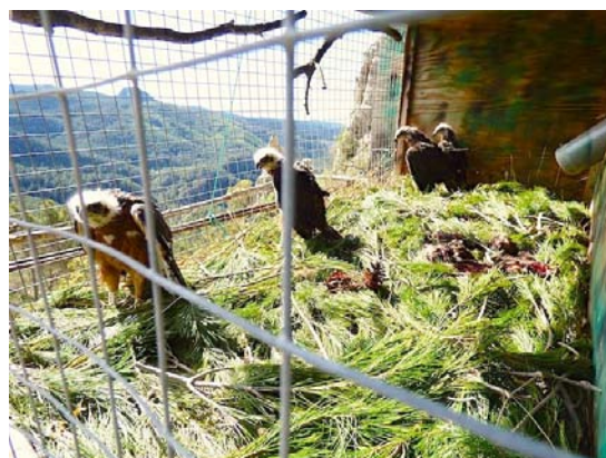
Foto 2: Nido artificial del hacking cerrado utilizado en 2013 y 2014.