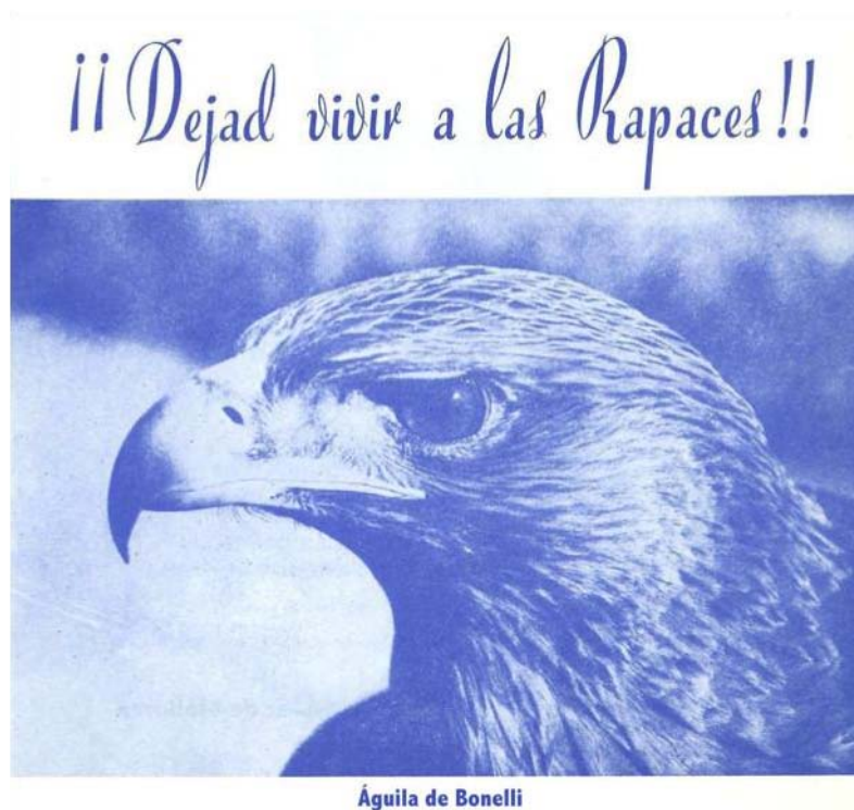
Fig. 1. Portada del díptico de protecció de rapaces en Mallorca (1970)