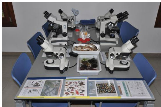
Fig 2. Laboratori de l'Aula de la Mar on es realitzen bona part de les activitats.

Quatre o cinc dies per setmana es realitzen activitats, reservant un dia a la setmana per a l'obtenció de mostres a partir de restes d'organismes que es recol·leixen a les platges o que són cedits per pescadors. Alguns dissabtes també es porten a terme jornades de portes obertes en les que també s'oferten les activitats.