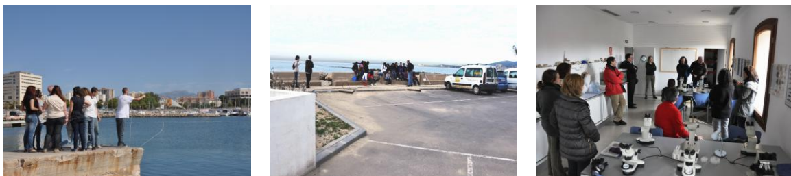
Fig. 3. Alumnes al port, a la platja i al laboratori durant les activitats.

La major part de grups de visitants són de Palma, degut al problema econòmic que representa el desplaçament per als centres de la resta de l'illa. Alguns centres de fora de les Illes Balears també han visitat l'Aula a través de programes educatius, i alguns centres de secundària que participen en el programa Comenius porten grups d'alumnes estrangers (d'Alemania, Itàlia, França, Suècia, Turquia, Grècia, etc.). Quant als grups d'altres col·lectius, destaquen els grups familiars, en els dissabtes de portes obertes i en períodes de vacances, i els de centres amb persones amb qualche necessitat especial o col·lectius vulnerables. Des d'aquest primer curs fins a l'actual (2014-15) el nombre d'activitats i visitants s'ha incrementat cada any, passant de les 52 activitats realitzades i 1384 visitants del curs 2010-11 a les 115 activitats ja reservades en el curs 2014-15, amb una previsió de visitants de més 3000 persones (Fig. 5). El menor nombre de visites en el primer curs fou degut a que les activitats s'iniciaren al gener de 2011, un cop ja iniciat el curs, i la petita davallada de visites centres educatius en el curs escolar 2013-14 correspon als problemes que hi hagué en aquest curs a la comunitat educativa. El nombre de visites de grups de visitants no escolars en aquest darrer curs és menor que el del curs passat degut a que quasi tots realitzen la reserva amb pocs dies d'antelació i falten encara els que vendran en el primer semestre del 2015.