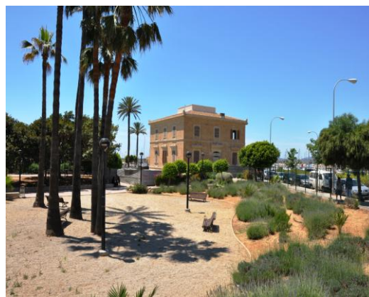
Fig.1. Complex de Sa Petrolera l'any 1955 i edifici de Sa Petrolera a l'actualitat.