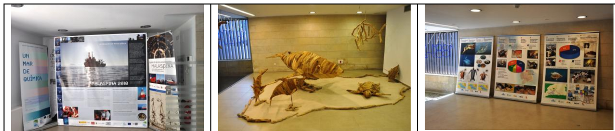
Fig. 6. Diferents exposicions de temàtica marina realitzades a Sa Petrolera.

Quant a les diferents activitats, el taller de plàncton i “Vine i coneix la mar” són les que més es repeteixen. Els motius d’aquestes dades són dos: que aquestes dues activitats es poden realitzar durant tot l’any, mentre que els tallers de posidònia i de restes d’arribada només es fan de setembre a maig, i que la major part de grups no escolars tria l’activitat de “Vine i coneix la mar”, de dues hores. La raó de la no realització dels tallers de posidònia i de restes d’arribada durant l’estiu és que la platges on normalment es fa part de l’activitat són ocupades pels turistes i netejades a diari de restes naturals i residus per brigades de manteniment. En els casos dels centres educatius que porten alumnes de tots els nivells de secundària i batxillerat, solen realitzar el taller de restes d’arribada a 1r d’ESO, el de posidònia a 2n i 3r d’ESO i el de plàncton a 4t d’ESO i batxillerat.