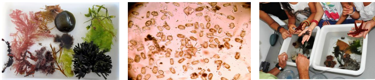
Fig. 4. Mostres recollida a la platja, mostra de plàncton observada al laboratori i “Toca-Toca”.