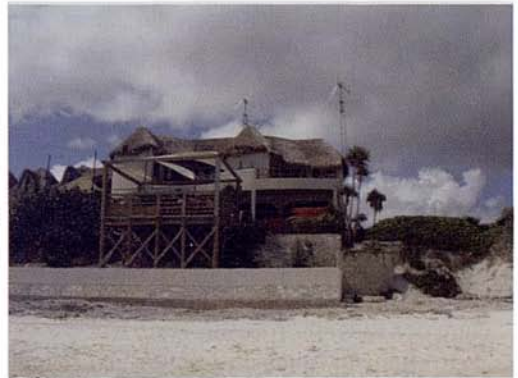
Fig. 13. Sitio límite sur del Sector 1.

La franja de duna aquí tiene un aspecto más arenoso-pedregoso, que en los dos tramos anteriores, y es muy notable el desarrollo de escarpes pronunciados en el frente delantero, originados por procesos de erosión relacionados con el paso de huracanes y tormentas.