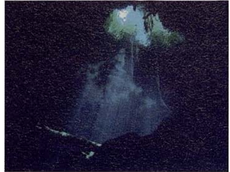
Fig. 8. Fotografía subacuática de un Cenote. Fig. 8. Underwater photo "Cenote".

en general se mantiene el predominio de condiciones de naturalidad de los paisajes costeros.