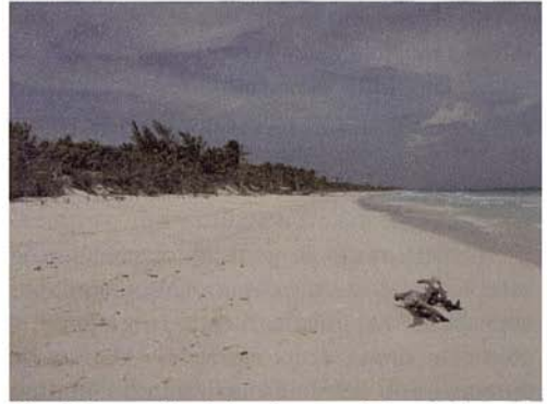
Fig. 7. Extensión de la playa en el Sector 1.

Desde el punto de vista físico geográfico, la zona corresponde a la región de Yucatán, caracterizada por amplias planicies, en las que predomina el relieve de llanuras jóvenes, holocénicas y pleistocénicas