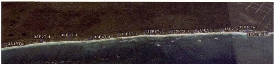
Figs. 3, 4 y 5. Fotografías aéreas de los Sectores 1, 2 y 3 de las playas de Tulum.