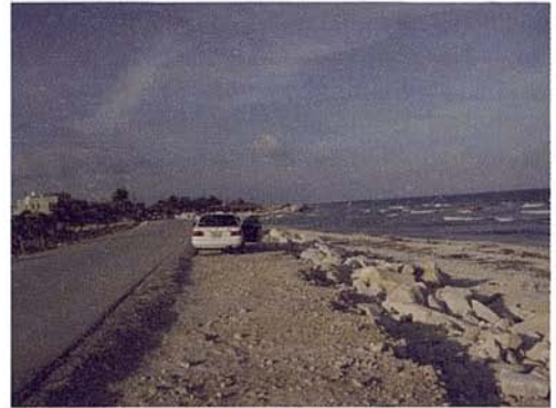
Fig. 14. Vista del Sector 2 (Hotel Zamas – Punta Piedra).

dunas fósiles recubiertas por casquetes de rocas calizas, que separa al sector 1 y del sector 2.