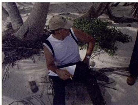
Figs. 1 y 2. Trabajo de campo – Método de observaciones generales por sectores de playa – Levantamiento de campo a través de listas de chequeo.

Figs. 1 and 2. Fieldwork - Method of general comments on areas of the beach - Field survey through checklists.