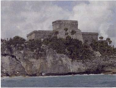
Fig. 6. “El Castillo” Zona arqueológica de Tulum.