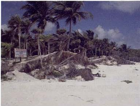
Fig. 12. Alteración de la duna debido a procesos naturales (huracanes) y antrópicos (acceso a la playa).

Se distingue la parte más septentrional de este sector 1, desde el límite norte con el Castillo Maya hasta lo que se conoce como "Playa Maya", a lo largo de unos 800 metros en total, que viene representando casi el 55 % del mismo, que se caracteriza una amplia subzona de berma y franja de arena por delante de la primera duna, la cual rebasa los 60-70 metros de ancho total, a lo cual se deben sumar la franja de dunas, que en realidad son cadenas de dunas, que llegan a rebasar los 100 metros de desarrollo hasta sus contactos con los boques costeros interiores o carreteras y partes antropizadas. Es realmente un impresionante sistema playadunas, que lamentablemente no cuenta con un manejo adecuado.