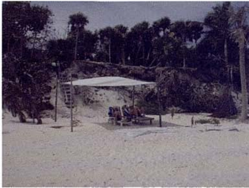
Fig. 16. Equipamiento recreativo de bajo impacto en el Sector 3.

Así encontramos un tramo continuo al ya descrito, que se inicia en las inmediaciones del lugar turístico que se conoce como “Casa Magna” y se extiende por unos 205 metros, en el que la diferencia principal viene dada por el nivel de alteración de la zona de dunas, que ha sido fragmentada y aplanada morfológicamente, con alteraciones radicales de su vegetación original que ha sido parcialmente sustituida por plantaciones de cocoteros, vegetación herbácea secundaria y áreas de jardinería, y sobre la cual se han ubicado cabañas que aunque espaciadas unas de otras, están cimentadas sobre el fundamento arenoso.