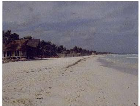
Figs. 9 y 10. Berma provocada por el proceso erosivo.