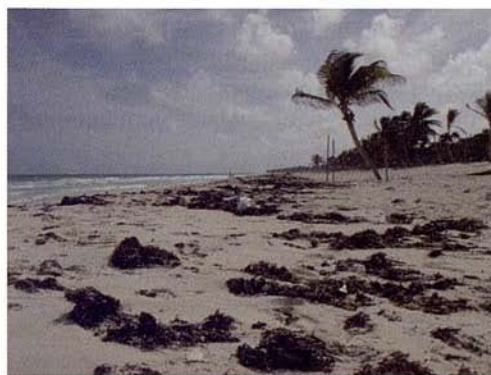
Fig. 15. Perfil de playa del Sector 3.

El nivel de uso y explotación del sistema playa-dunas es actualmente muy bajo, pero resulta muy preocupante desde el punto de vista de la conservación ecológica y ambiental que una gran parte de la franja de dunas se encuentren ya cercadas y señalizadas como áreas privadas, en las que está prohibido el acceso público, y que parecen predestinadas en muy poco tiempo a la transformación en aras del desarrollo de infraestructuras urbanas y turístico-recreativas.