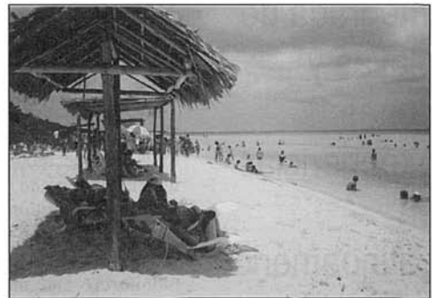
Fig. 1. Playa de Varadero, Cuba. Fig. 1. Varadero Beach, Cuba.

Evidentemente, el desarrollo turístico se lleva a cabo mediante acciones sobre la costa, las cuales demandan grandes inversiones económicas. Razón por la cual