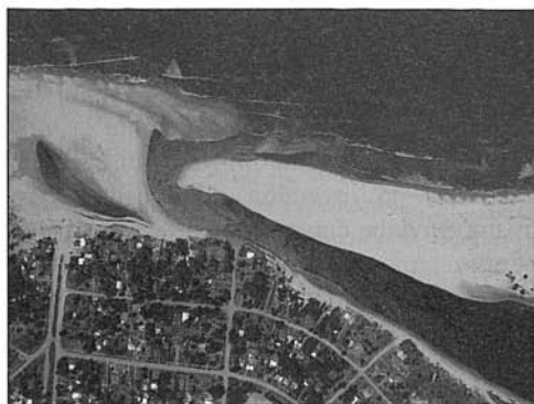
Fig. 3. Foto aérea de San José, Uruguay. Fig. 3. Aerial photo of San José, Uruguay.

Desafortunadamente todavía faltan estándares internacionales reconocidas para el monitoreo de las playas, aunque para algunos parámetros (como los arrecifes) ya se encuentren metodologías recomendadas al nivel internacional y regional. Entre los objetivos de la Red ProPlayas, una red regional de expertos en el manejo de playas en el Caribe y Suramérica, es proveer a la comunidad interesada un inventario de metodologías y herramientas genéricas para el monitoreo integrado de las playas.