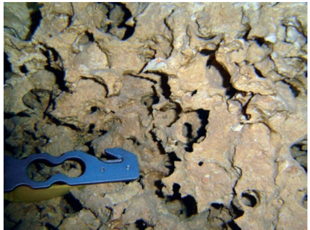
Figura 7: Morfologies espongiformes (microformes) de la cova des Coll (Felanitx). Estan formades per un conjunt pròxim d'irregularitats com són forats, concavitats, protuberàncies, anells, tubs i altres, presents a la volta, parets o pis i que de vegades formen una verdadera randa de pedra.

Les seves mides van de dimensions d'ordre de centímetres a metres, i tal com indica el seu nom pengen del sostre (Fig. 9a). Hi ha diferents mecanismes generadors de penjants. Per una banda hi ha els penjants procedents d'antics envans que són de forma allargada. També n'hi ha producte de la dissolució i separació de columnes de roca. Un altre tipus de mecanisme formatiu és la corrosió diferencial al sostre de sales i galeries. Dins aquest darrer