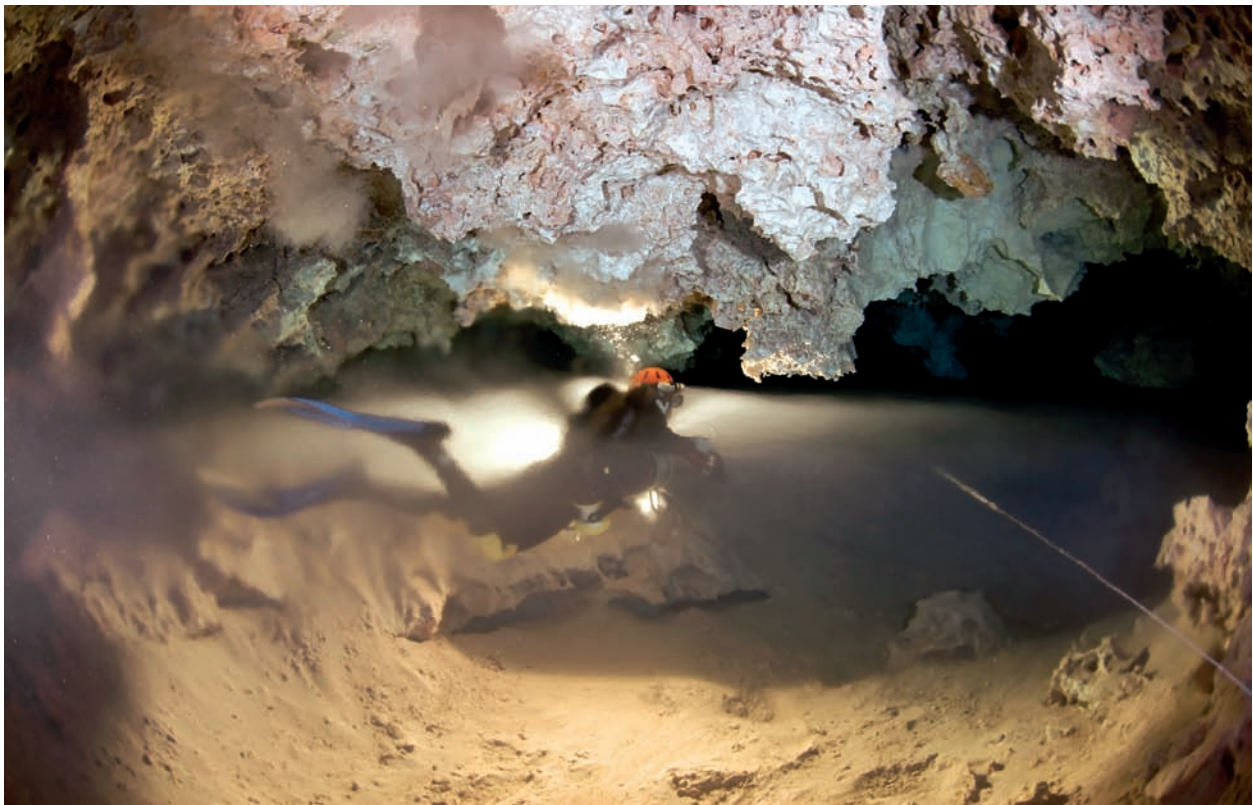
Figura 4: Galeria freàtica de secció irregular del sistema Gleda-Camp des Pou (Manacor). Moltes galeries, especialment quan el control estructural és menys important, presenten un aspecte més irregular i caòtic.