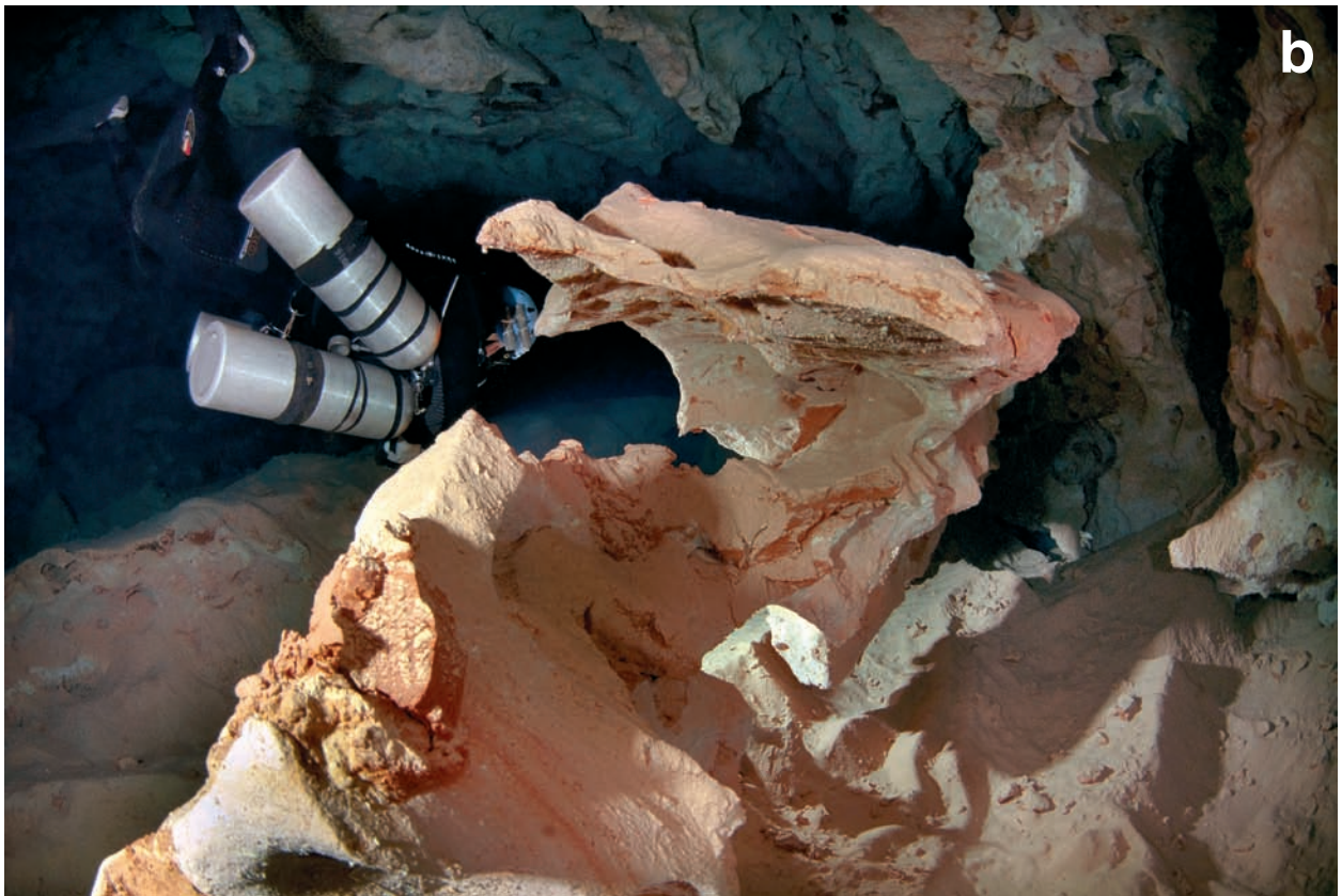
Figura 9: A. Penjant de la cova des Pas de Vallgornera amb abundants concavitats poc marcades i tupins sobreimposats. Darrera l'espeleòleg es pot apreciar una columna de roca. B. Pinnacle que s'ha generat a partir de la corrosió d'un envà del sistema Gleda-Camp des Pou.