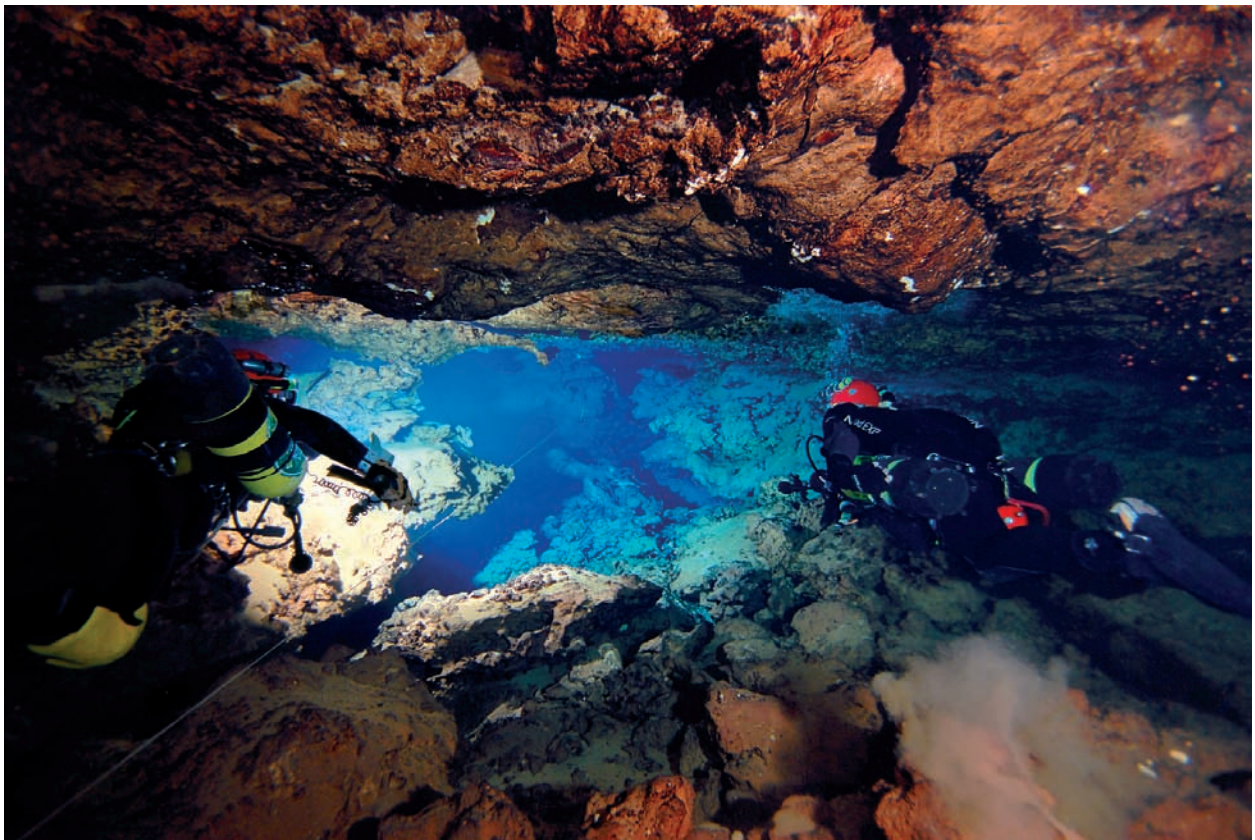
Figura 1: Galeria freàtica de control estructural estratigràfic de la cova d'en Bassol (Felanitx). S'aprecia que la galeria segueix un pla d'estratificació que condiciona la seva secció de tendència horitzontal.

A la cova des Pas de Vallgornera es troben especialment al sector Antic, de secció generalment irregular i que no segueixen una direcció clara, no presenten trams molt rectes i allargats, com és el cas de les galeries de control estructural tectònic i presenten abundants galeries laterals. A la cavitat es troben especialment a les fàcies de front d'escull i, a les fàcies amb clapetes d'esculls existents dins del lagoon extern, com és el cas