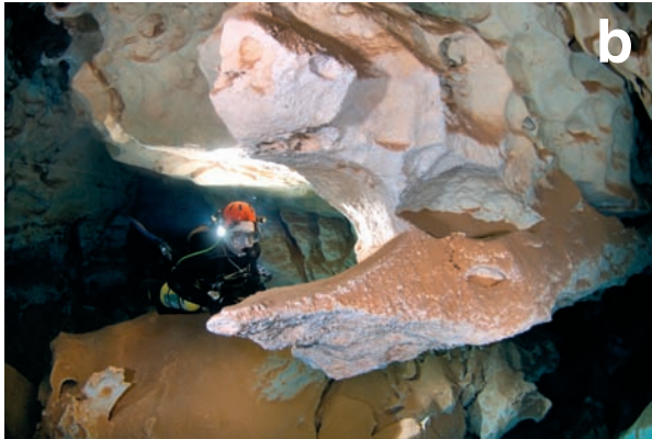
Figura 8: A. Arc. Són de mida més petita que els ponts i procedeixen de la dissolució progressiva d'altres morfologies. B. Esperó. Protuberància lateral generada sovint mitjançant la dissolució progressiva de ponts, arcs i envans.