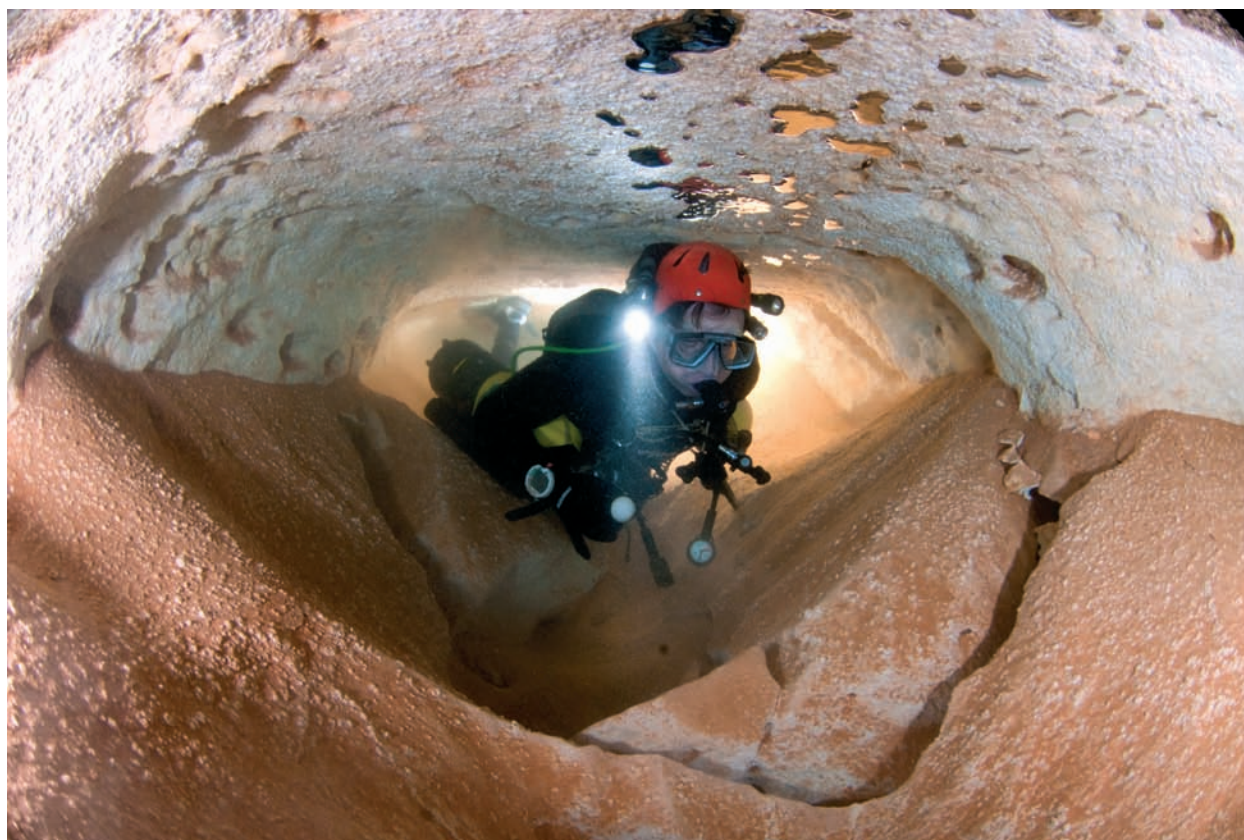
Figura 3: Galeria freàtica de secció circular de la cova des Pas de Vallgornera (Llucmajor).