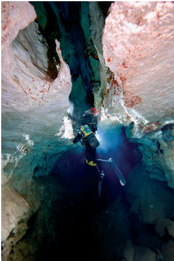
Figura 2: Galeria freàtica de control estructural tectònic de la cova des Coll (Felanitx). Les diàclasis han servit de línies de menor resistència per a la corrosió i donen lloc a les galeries que en secció transversal tenen una tendència vertical.