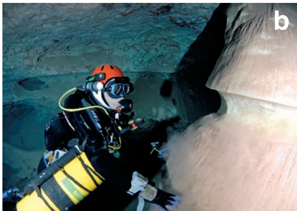
Figura 6: A. Regates de corrosió en dos nivells superposats de la cova des Pas de Vallgornera. S'aprecien també al sostre morfologies espongiformes a escala de microformes. B. Detall d'una regata de corrosió que afecta a un massís estalagmític i a la roca mare de les parets. Sistema Gleda-Camp des Pou. C. Pont de roca de la cova des Coll. D. Envà de roca que separa dues galeries freàtiques. S'aprecien també regates de corrosió i facetes. Cova des Pas de Vallgornera.