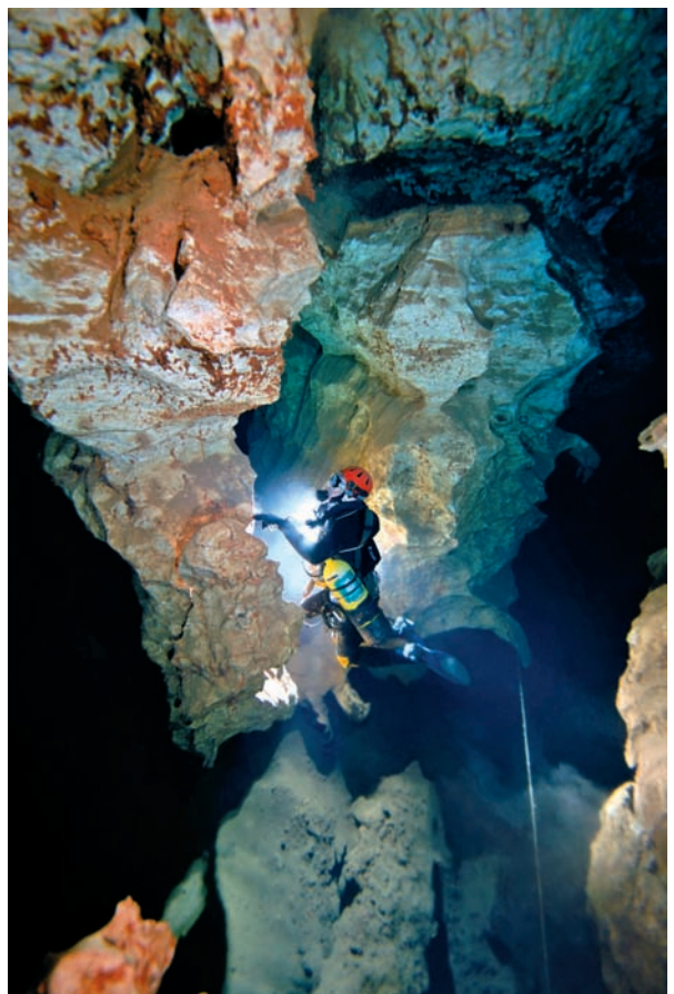
Figura 5: Columnes de roca de la cova des Coll (Felanitx). Es tracta de morfologies de corrosió generades a partir d'envans en avançat estat d'evolució.

Longitudinalment són de petites dimensions i acaben de forma brusca, com un cul de sac, sense possibilitats de continuació. La seva longitud és molt variable, encara que amb aquesta denominació únicament incloem les que no superen la desena de metres. Les de majors mi-