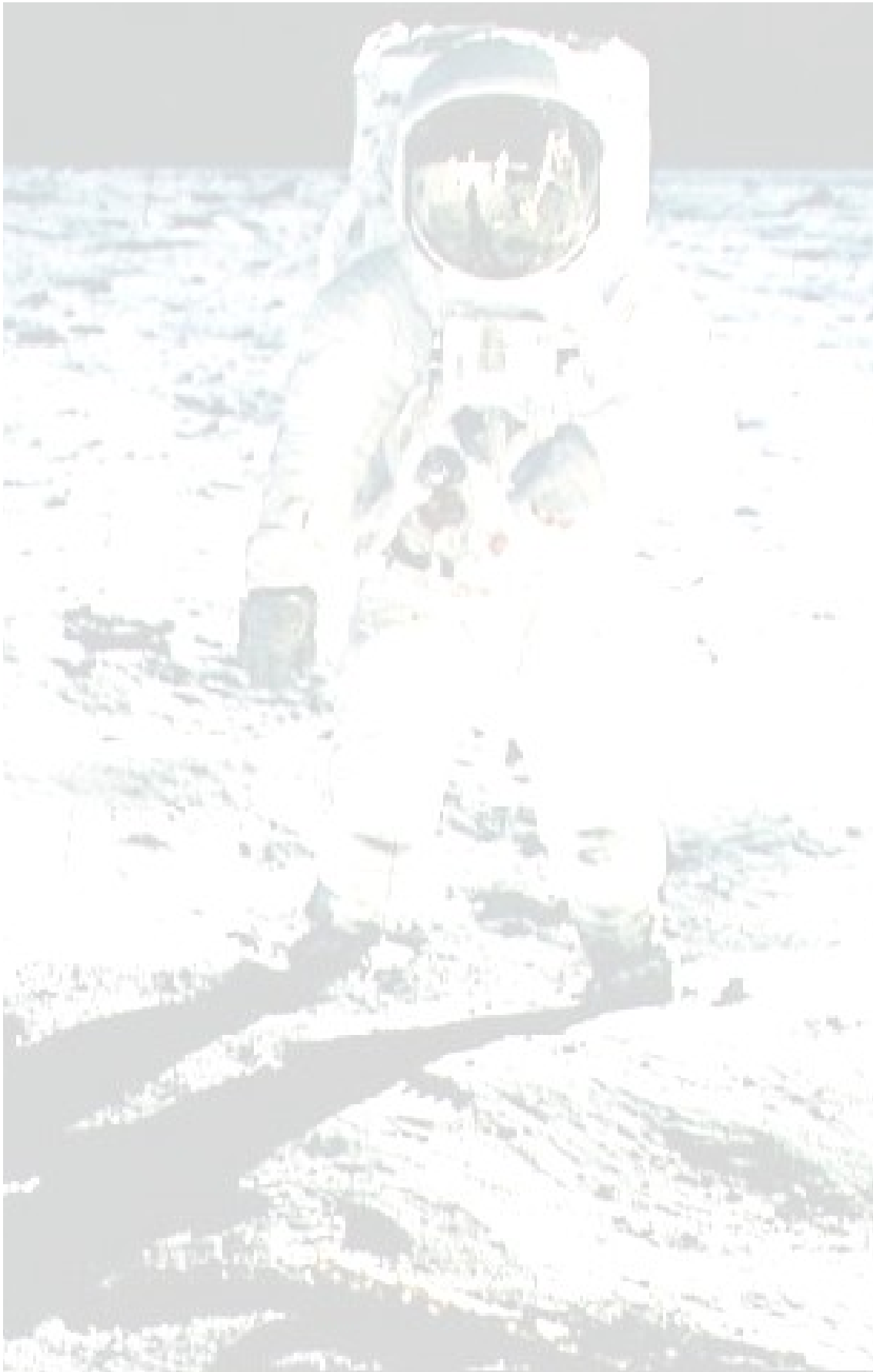
L'astronauta Buzz Aldrin caminant per la Lluna.