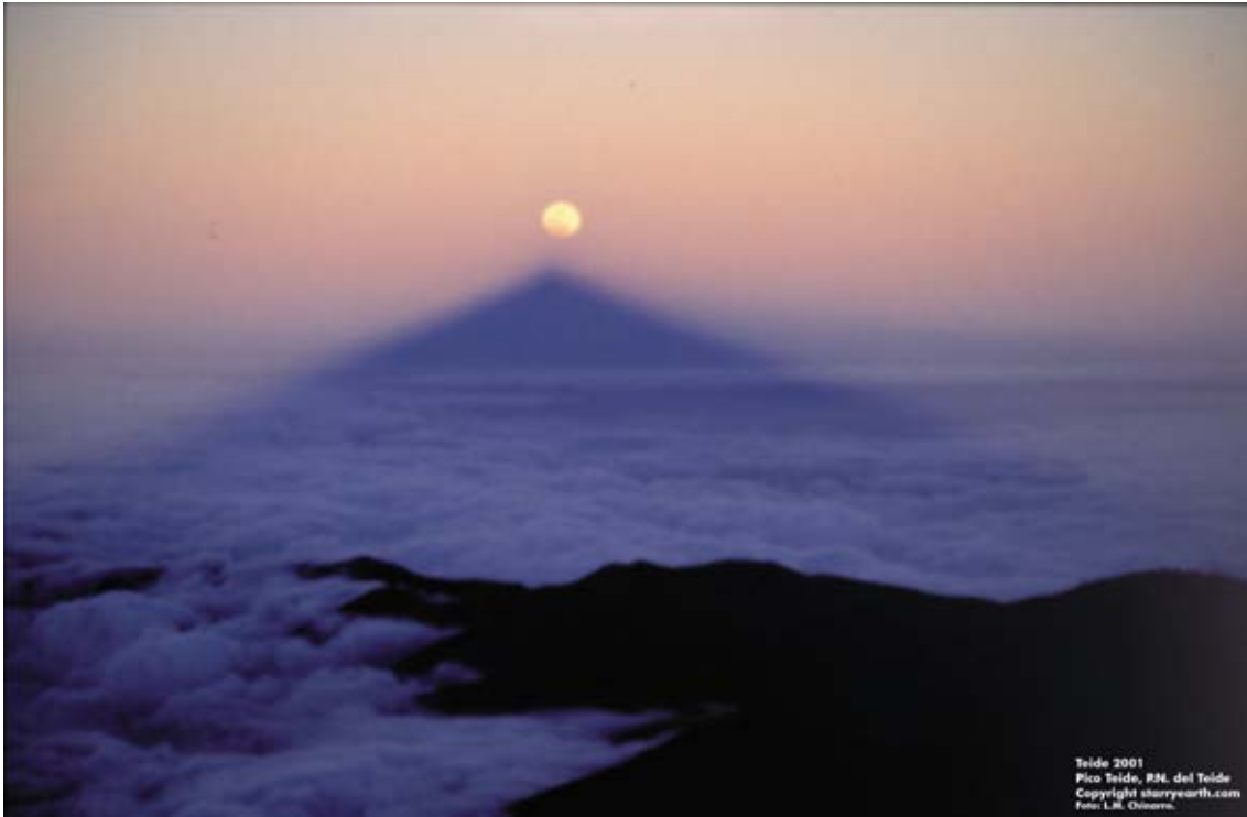
Figura 2: Eclipse total de Luna desde la cima del Teide el día 9 de enero de 2001. La sombra del Teide proyectada sobre la atmósfera terrestre apunta directamente a la luna eclipsada.