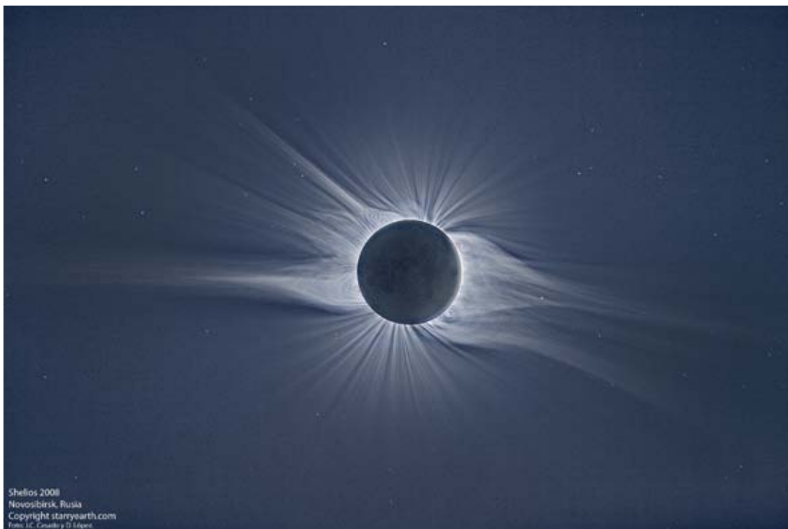
Figura 7: Formación de las perlas de Baily (luz del sol atravesando los valles lunares) en el eclipse total del 22 de julio de 2009. La imagen es una composición del segundo y tercer contacto.