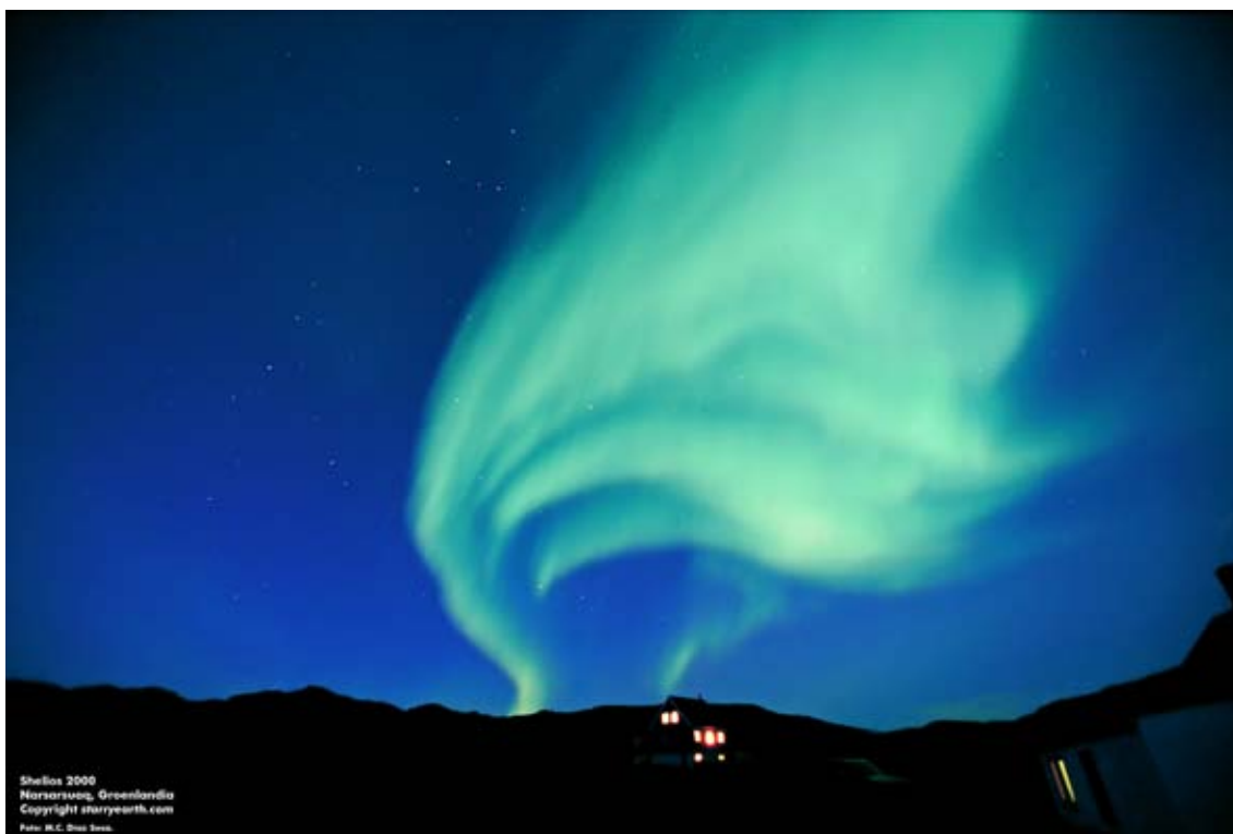
Figura 1: Aurora Boreal observada desde el fiordo de Tasiussaq al sur de Groenlandia, en septiembre del año 2000. En la parte superior puede observarse la constelación de Casiopea.

La expedición Shelios 2000 tuvo como objetivo viajar hasta el sur de Groenlandia para captar imágenes de las Auroras Boreales. Fue entre el 29 de agosto y el 14 de septiembre, fechas idóneas para la observación de las auroras ya que el Sol se encontraba en un periodo de máxima actividad. Las imágenes (Fig. 1) de las auroras sobre los hielos glaciares y la realización de un reportaje sobre el cambio climático en colaboración con TVE fueron los dos hitos de la expedición.