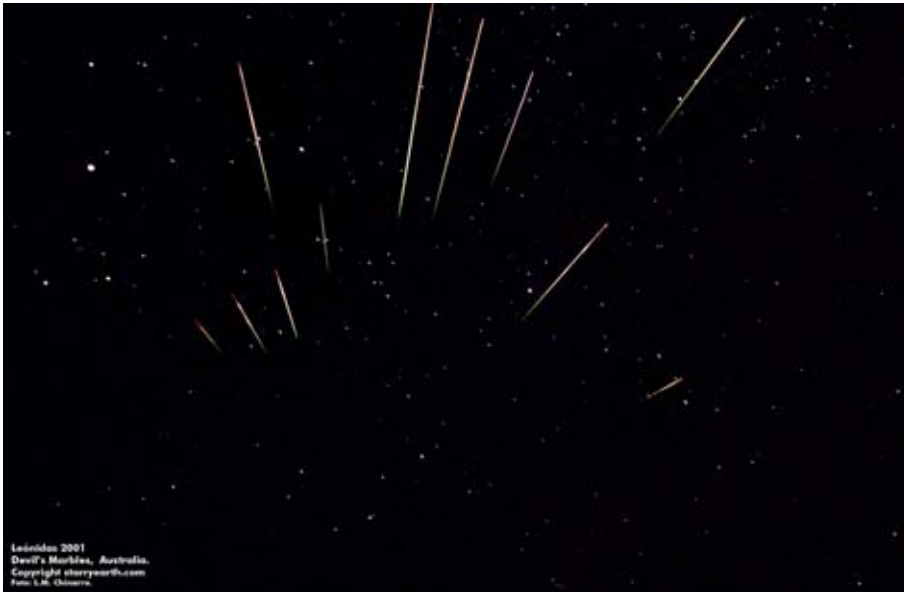
Figura 3: Meteoros originados en la tormenta de estrellas de las Leónidas del 19 de noviembre de 2001. La observación fue realizada desde Devil's Marbles en pleno desierto australiano.