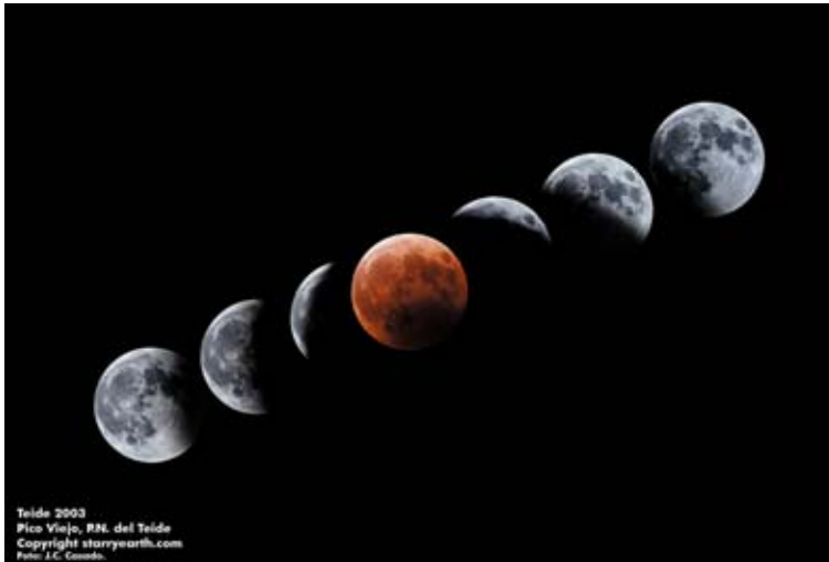
Figura 5: Desarrollo de la fase central del eclipse total de Luna del día 16 de mayo de 2003 desde el mirador de Pico Viejo (Parque Nacional del Teide, Tenerife). Nótese la coloración rojiza adquirida por la luna eclipsada consecuencia de la refracción y enrojecimiento de los rayos solares por la atmósfera terrestre.

Figure 5: Development of the middle phase of the total lunar eclipse of May 16, 2003 from the viewpoint of Pico Viejo (Parque Nacional del Teide, Tenerife). Note the reddish coloration acquired by the moon eclipsed result of refraction and redness of the sun by the Earth's atmosphere.