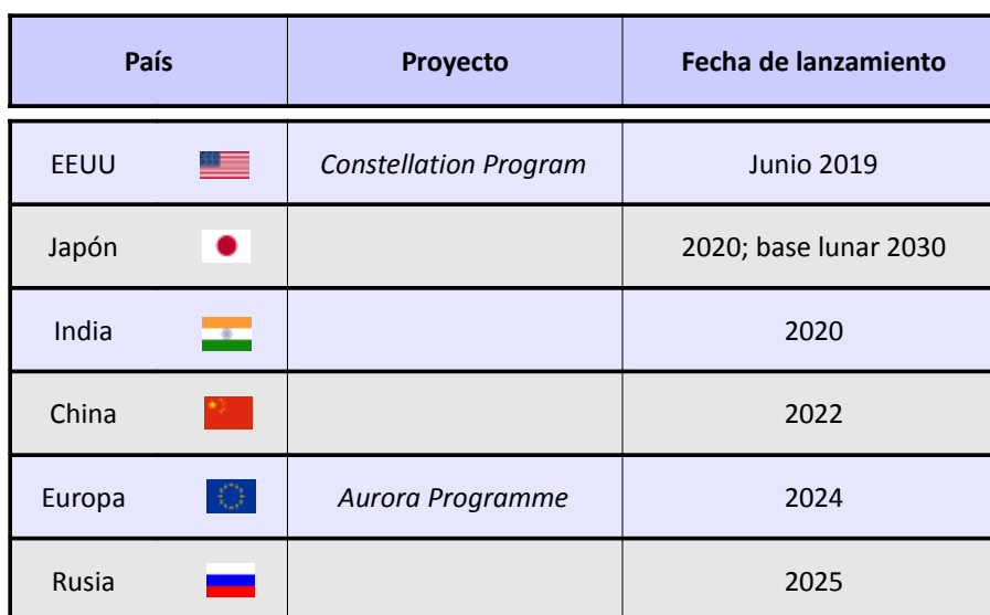
Tabla1: Futuras misiones tripuladas a la Luna.

Otros problemas como puede ser el riesgo a la exposición a altos niveles de radiaciones ionizantes pueden suponer un obstáculo adicional, además del coste, para misiones prolongadas en la Luna o misiones a Marte.