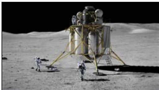
Figura 22: El Módulo Lunar ALTAIR, vehículo para el transporte de los astronautas a la superficie lunar, formará parte del Programa Constellation.

El ALTAIR, al igual que el LEM del Apolo, no es reutilizable y es desprendido después de haber sido utilizado.