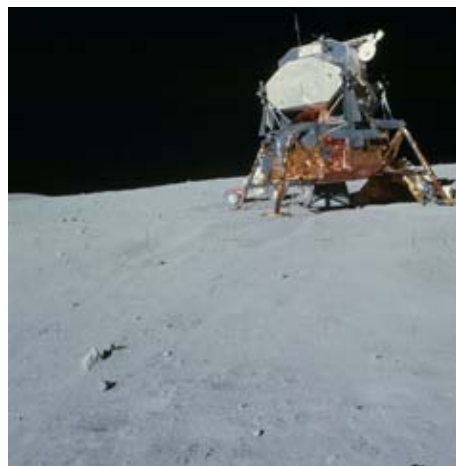
Figura 7: El Módulo Lunar, LM, fue diseñado únicamente para aterrizar en la Luna y ascender desde la superficie lunar hasta el Módulo de Mando, CM.

Tres de las cuatro patas del módulo de descenso iban equipadas con un sensor de 173 cm de largo, que tenía como misión indicar a los pilotos el momento del contacto con la superficie lunar para así detener el motor de frenado, la última pata portaba la escalerilla de descenso.