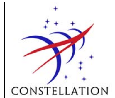
Figura 20: Logotipo de Constellation, futuro programa de vuelos tripulados de la NASA.

Al igual que su predecesor el LEM del Apolo, ALTAIR constará de dos fases: una de ascenso que albergará a los 4 tripulantes, y una fase de descenso que tendrá las patas de aterrizaje, la mayor parte de los consumibles de la tripulación (oxígeno y agua), e instrumental científico. A diferencia del LEM del Apolo, el ALTAIR se dirigirá a las regiones polares de la Luna, que son las zonas preferidas por la NASA para la construcción de futuras bases lunares.