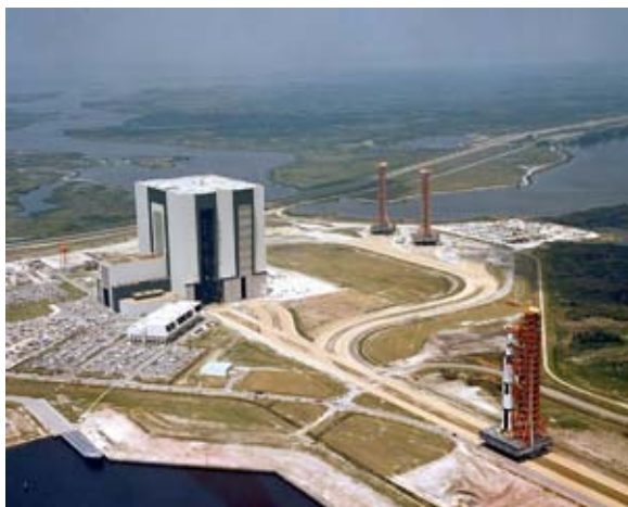
Figura 8: Kennedy Space Center con el gigantesco edificio Vehicle Assembly Building, en el que se ensamblaban los componentes del Saturno V.

Como decía Mr. James Webb, administrador de la NASA desde 1961 hasta 1968, “el camino hacia la Luna empieza entre la piedra, el acero y el cemento de la Tierra”.