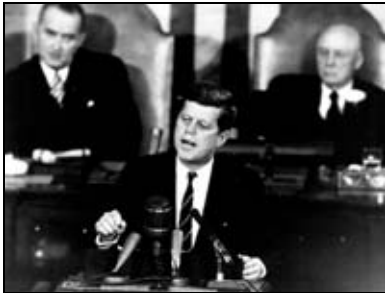
Figura 2: El Presidente Kennedy en el Congreso de los EEUU, el 25 de mayo de 1961, día en el que anunció el compromiso de enviar el hombre a la Luna..

Por aquel entonces apenas un mes antes había tenido lugar el primer vuelo al espacio de un astronauta americano, y ni siquiera se habían realizado vuelos tripulados en órbita terrestre. Incluso dentro de la propia NASA había dudas sobre la posibilidad de poder cumplir con el ambicioso objetivo fijado por Kennedy.