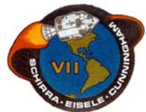
Figura 9: Insignia de la misión Apolo VII.

Figure 9: Apollo VII mission insignia.