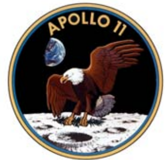
Figura 13: Insignia de la misión Apolo XI. (NASA/Cortesía de nasaimages.org).