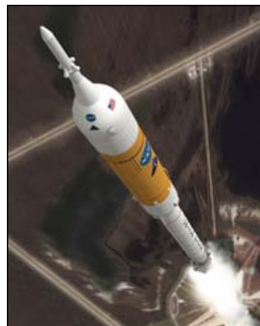
Figura 23: Cohete lanzador ARES I, diseñado para transportar el módulo ORION hasta una órbita baja terrestre.

El EDS es un diseño evolucionado de la 3ª fase, S-IVB, del Apolo, con mayor capacidad de tanques de combustible (LOX y LH 2 ) y utilizando un motor J-2X del mismo tipo que el utilizado en el ARES I.