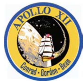
Figura 14: Insignia de la misión Apolo XII.

La misión estuvo a punto de ser abortada debido al impacto de un rayo en el despegue que causó la pérdida de telemetría, afortunadamente solventado durante el vuelo.