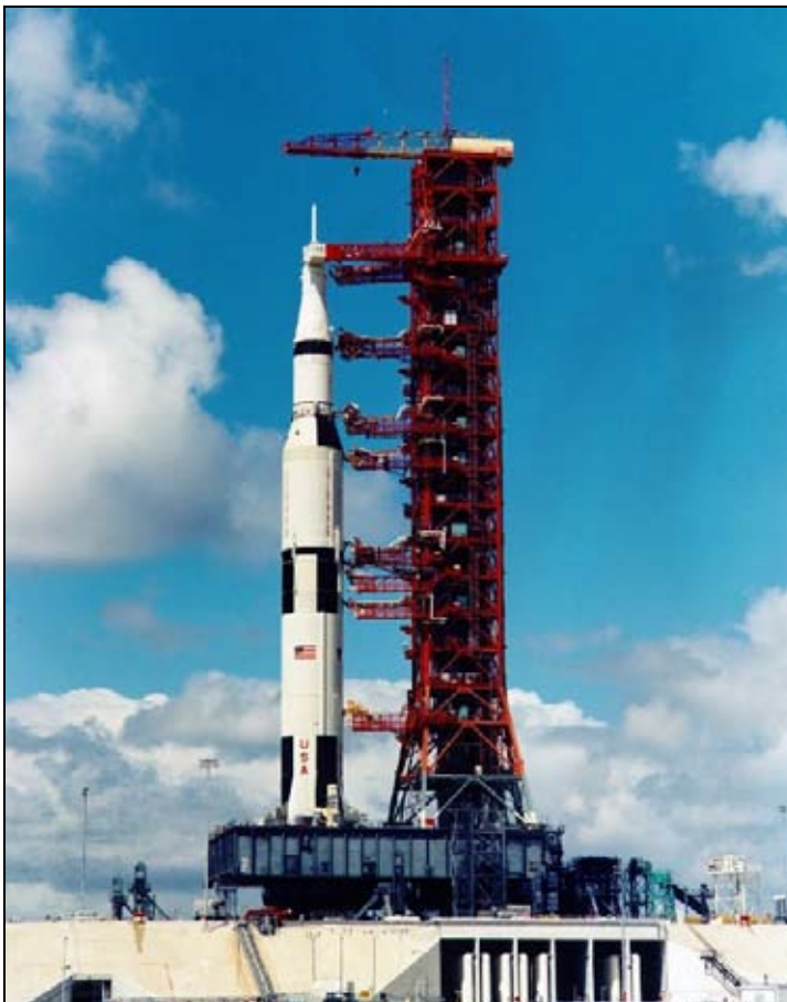
Figura 5: El cohete lanzador Saturno V..

El Saturno V medía 111 metros y tenía una capacidad para transportar 118 000 kg a una órbita LEO y 47 000 kg a la Luna. Consistía en 3 fases y de una Unidad de Instrumentos con el sistema de guiado del lanzador.