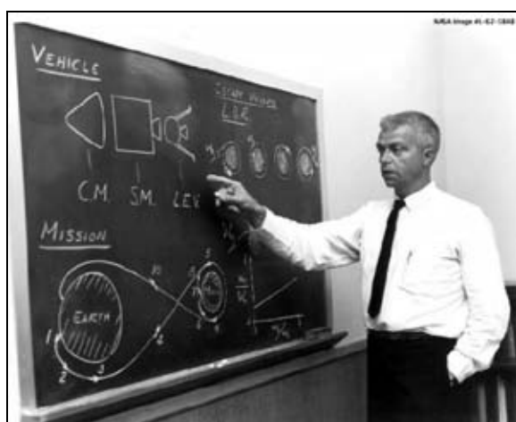
Figura 4: El Dr. John Houbolt encabezaba el sector que defendía una misión a la Luna del tipo Encuentro en Órbita Lunar, LOR. (NASA/Cortesía de nasaimages.org).

Figure 4: The Dr. John Houbolt led the sector defended by a mission to the Moon of the Lunar Orbit Rendezvous kind, LOR. (NASA/Courtesy of nasaimages.org).