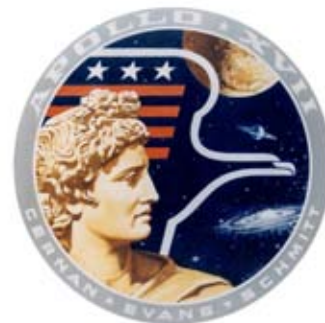
Figura 19: Insignia de la misión Apolo XVII. (NASA/Cortesía de nasaimages.org).