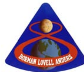
Figura 10: Insignia de la misión Apolo VIII.

Figure 10: Apollo VIII mission insignia.