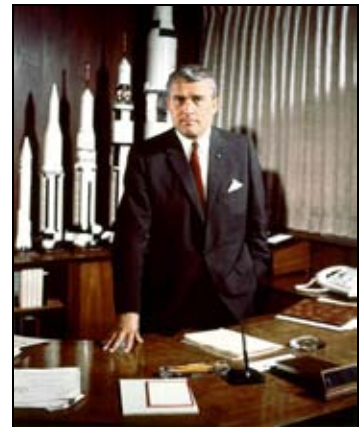
Figura 3: Wernher von Braun, figura decisiva del Programa Apolo.

Von Braun se convirtió en el director del Marshall Space Flight Center de la NASA y el principal diseñador del Saturno V, que llevarían a los estadounidenses a la Luna.