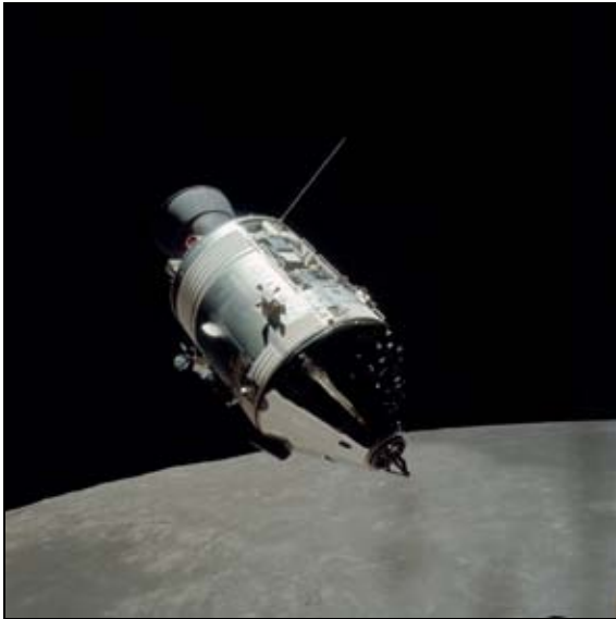
Figura 6: El Módulo de Mando, CM, y el Módulo de Servicio, SM, permanecían acoplados hasta el momento de la reentrada.

Figure 6: Command Module, CM, and the Service Module, SM, remained coupled to the time of reentry.