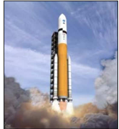
Figura 24: Cohete lanzador ARES V. (NASA/ Cortesía de nasaimages.org).

El módulo ORION sería devuelto al KSC para su reutilización.