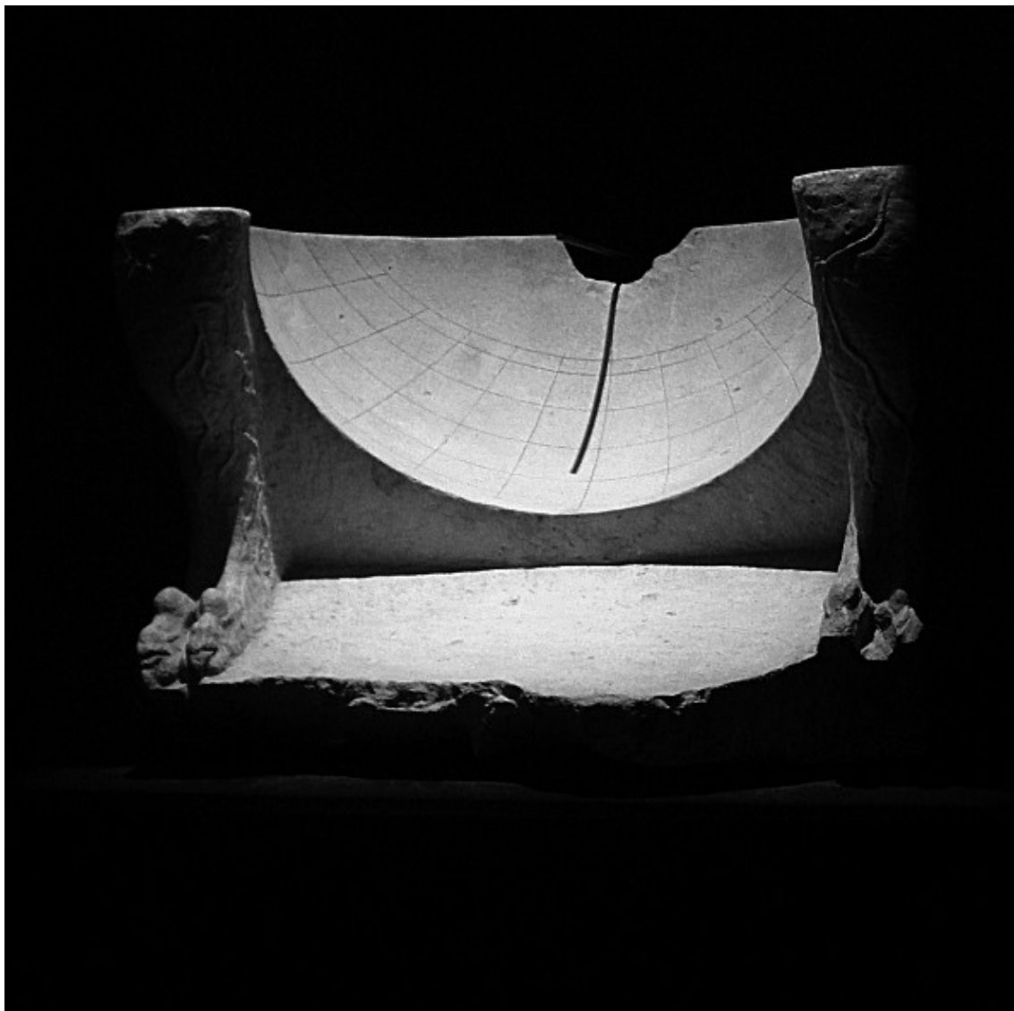
Figura 3: Escafé trobat a les excavacions de la ciutat hel·lenística de Ai Khanoum, a l'actual Afganistan, que pot datar-se entre el segle III i II aC i avui exposat al museu Guimet de París.

instruments; però, tenien una precisió que no superava el mig grau d'angle. Ja més avançat i posterior; però possiblement conegut a l'època hel·lenística, és el triquetrum.