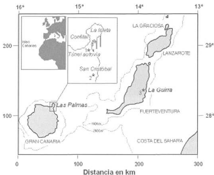
Fig. 1. Mapa de situación de los yacimientos paleontológicos de las Canarias orientales mencionados en el texto. Fig. 1. Map of Eastern Canaries showing paleontological sites mentioned in the text.

mencionan un punto de los depósitos a doble altura y casi diez veces más lejano de la costa lo que coincide más con la medición de Meco et al. (2002). La publicación de Zeuner (1958), algo confusa, proporciona alturas para Santa Catalina Resa (¿?) de +4.6 m -Epimonastirensis- y para Alcarabaneras (sic) de +7.5 m y para La Isleta (Confital) de +11.7 m -Monastirensis inferior-. Lecointre (1966) sitúa el punto más alto de la playa fósil a unos +8m en La Isleta (Confital) y Lecointre et al. (1967) señalan en el sitio de Las Alcarabaneras (sic), inmediato a Santa Catalina, que el depósito era visible durante la construcción de los baños públicos. Estos baños no están situados a altura superior a los +3 m. Para Klug (1968), que no los observa personalmente sino que recoge los datos de los mencionados autores anteriores, los mismos depósitos de Las Palmas, los sitúa a +15-18 m, atribuyéndolos al Eutirreniense, y a +7-8 m al Neotirreniense.