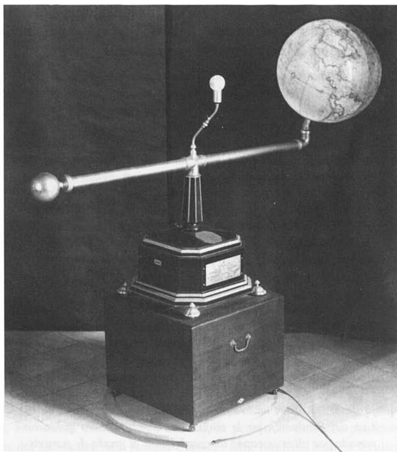
Figura 2: Esfera Terrestre giro-mòvil creada per Emili Sagristà. Es conserva un document amb l'explicació del seu maneig on s'indica que fou ideada i construïda durant el primer semestre de 1936 en el Seminari de Palma (vegeu Apèndix).

Figure 2: Esfera Terrestre giro-mòvil created by Emili Sagristà. A two page user's guide has been preserved. It is said that the device was figured out and built during the first semester of 1936 in the Seminary of Palma (see Annex I).