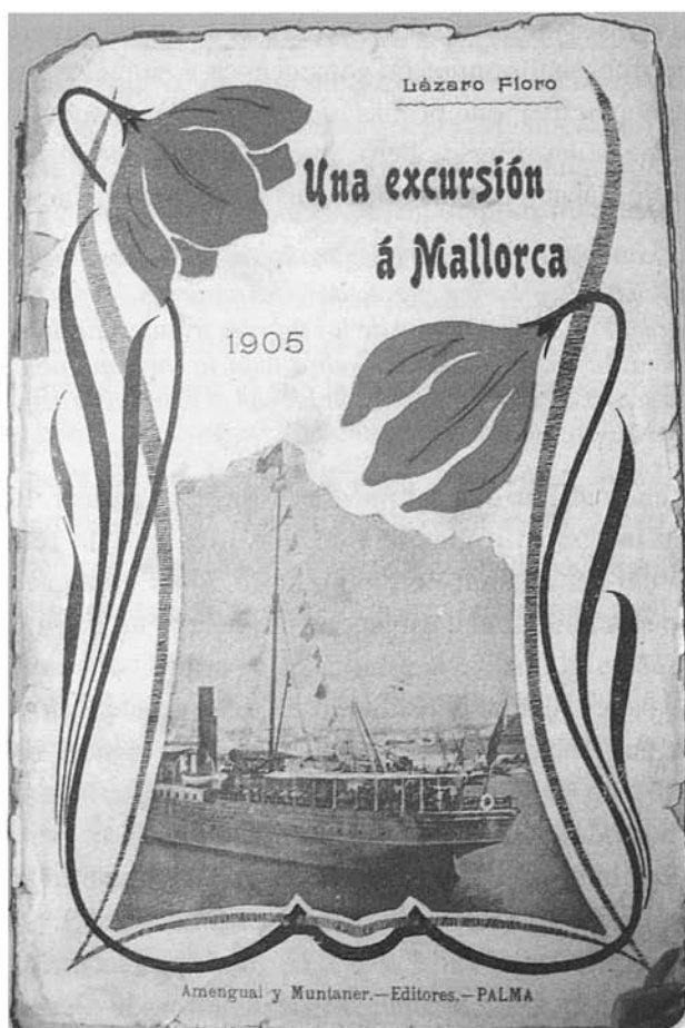
Figura 2: Coberta del llibre de Lázaro Floro.