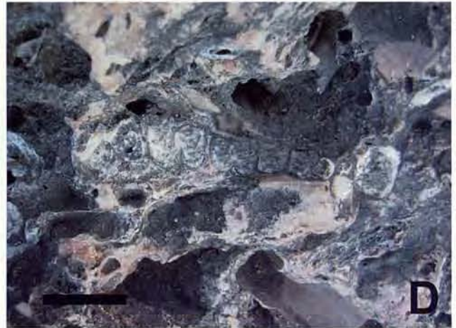
Fig. 1. A. Cova Estreta (Pollença, Mallorca). Acumulació en superfície d'ossos de M. balearicus . B. Cova des Moro. Excavació del Sector 3. Foto G. Santandreu. C. Cova Genovesa. Extracció subaquàtica d'ossos de M. balearicus . Foto G. Santandreu. D. Racó de s'Homo Mort. Sèrie dentària superior de M. cf. antiquus . Escala 2 cm.