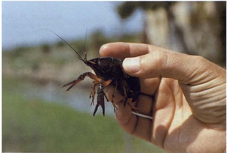
Procambarus clarkii de S'Albufera