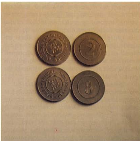
Monedes pròpies (Albufera Sociedad Anónima) Own money