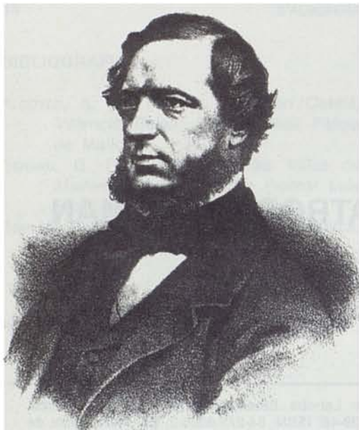
John Frederic Latrobe Bateman als 49 anys John Frederic Latrobe Bateman 49 years old (1859)