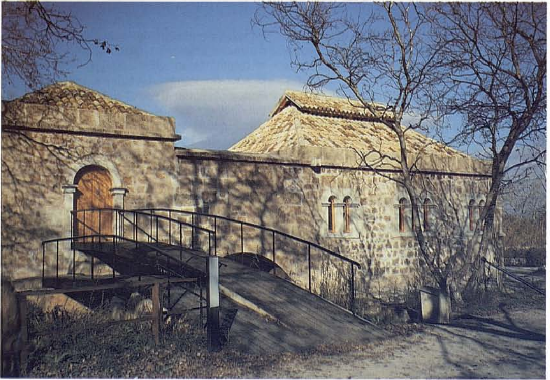
Centre d'interpretació i antiga casa de l'enginyer Bateman, "Ca'n Bateman". Interpretation center and house formerly occupied by the engineer Batemen, "Ca'n Bateman".

del nom de Gatamoix pel de la Colònia de Sant Lluís, 11 encara que també era coneguda popularment per "Poble Nou".