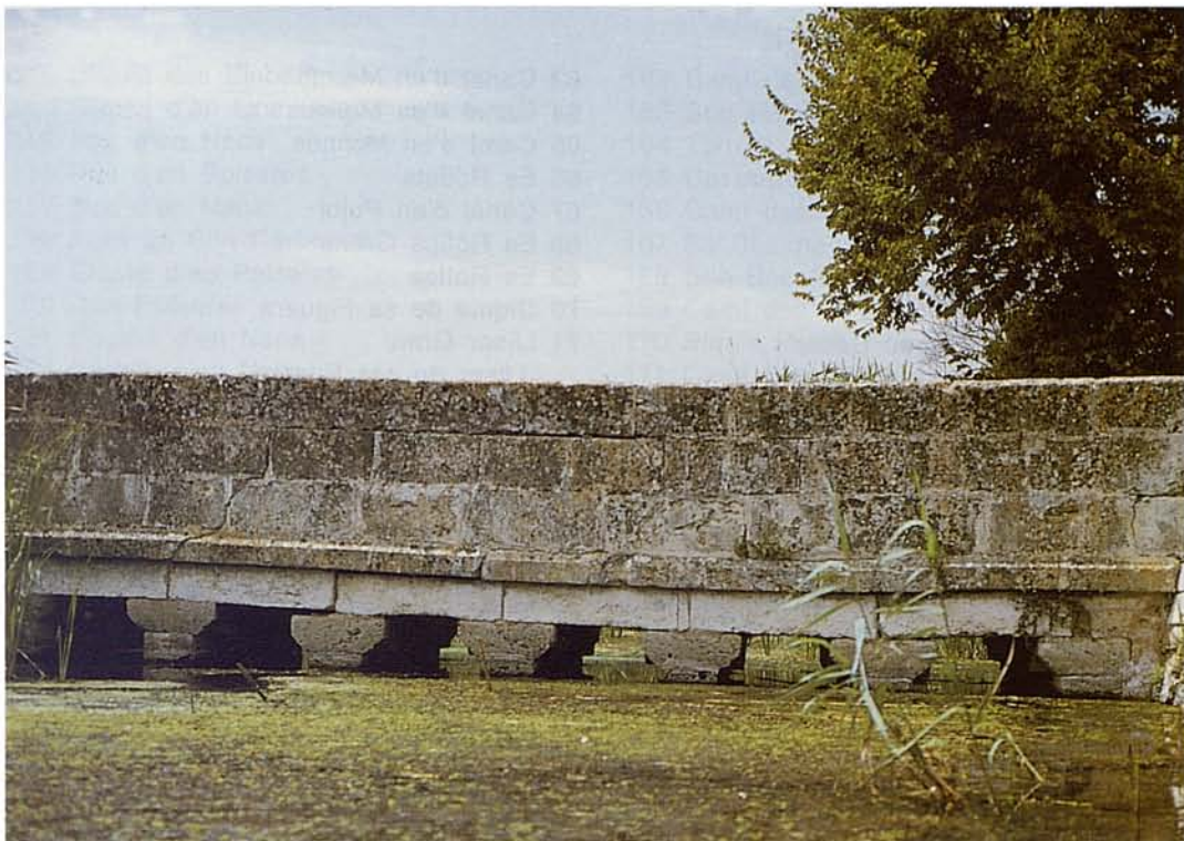
Pont de Son Carbonell amb cobertura de macròfits aquàtics Son Carbonell bridge showing aquatic macrophyte growth

metres, ja no veus el Tomir ni el Puig de Son Fe.