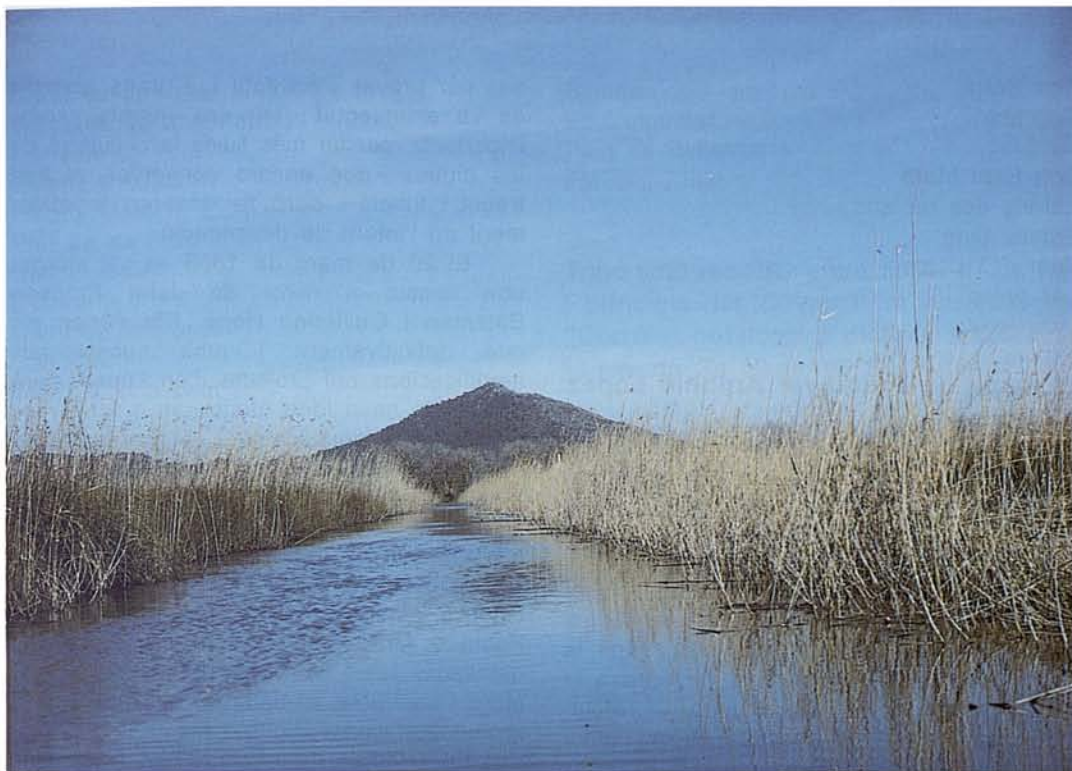
Canal den Pujol. Al fons el Puig de Sant Martí Pujol canal. In the background, the "Puig de Sant Martí"

Tot i lamentar aquesta irreparable pèrdua, pel comentari que fa Berard d'aquest plànol deduec que no devia ser dels millors i més detallats que va fer: "... las tierras que voy a demostrar sobre el siguiente plano, aunque formado sin escala ni justa proporción, por no permitir lo enfermizo de sus vapores el entretenerse allí por curiosidad..."