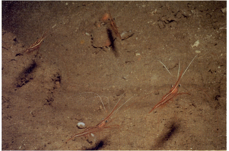
Foto 1. Parapandalus narval és una petita gambeta que viu en l'entrada d'algunes coves situades a molta fondària. Els exemplars de la fotografia provenen de l'entrada d'una cova al Cap Falcó, a -53 metres.

ni . Espècie molt comuna a les comunitats de dominància algal.