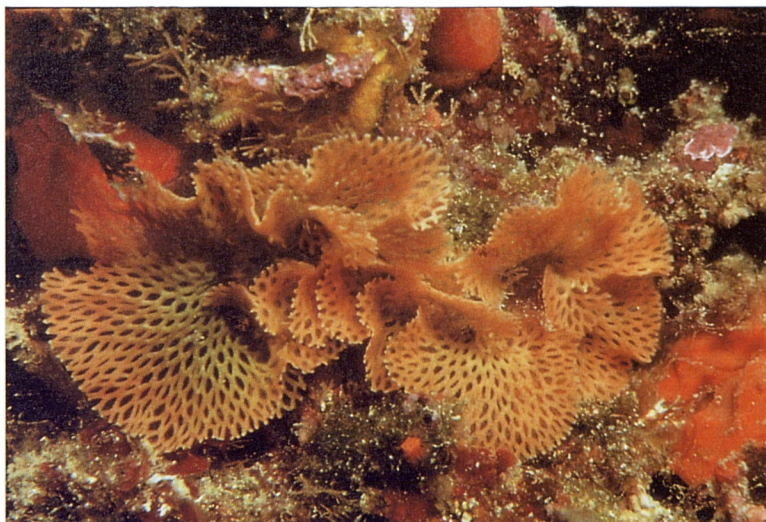
Foto 2. Les zones més fosques del coral·lígen i les coves semifosques són l'hàbitat preferit de diverses espècies de Sertella , com la que apareix a la fotografia (Cova des Calamars, -20 metres).