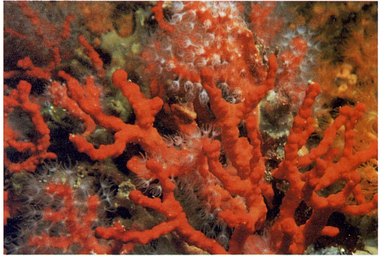
Foto 3. El corall vermell ( Corallium rubrum ) és molt rar a Cabrera, tot i que constitueix algun poblament important en indrets molt determinats del Sud-est de l'illa principal, entre -30 i -80 metres. (Fotografia d'Enric Ballesteros).

Halecium motzkossowskiae . A més d'aquestes espècies característiques, hom pot trobar-ne d'altres, com Clytia hemisphaerica , Obelia geniculata i Obelia dichotoma , entre moltes més, de caràcter purament oportunista.