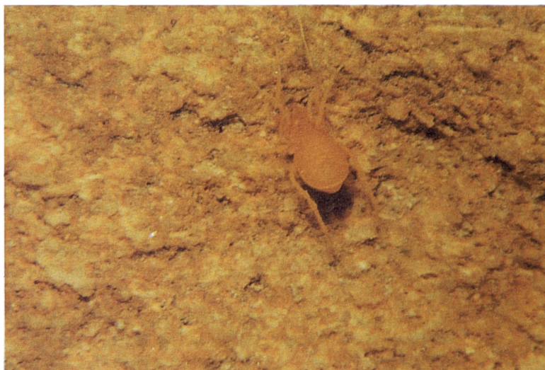
Fig. 2. Scotolemon krausi es troba a la part inferior de les pedres. La localitat de Cabrera on fou trobat amb més freqüència (Camí de la Serra de ses Figueres) fou batiat per nosaltres amb un nou topònim "el pinar dels Scotolemons". La seva mida és d'un poc més d'un mil·límetre.