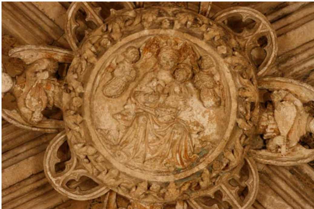
Fig. 4.- Sala Capitular. Clau de volta