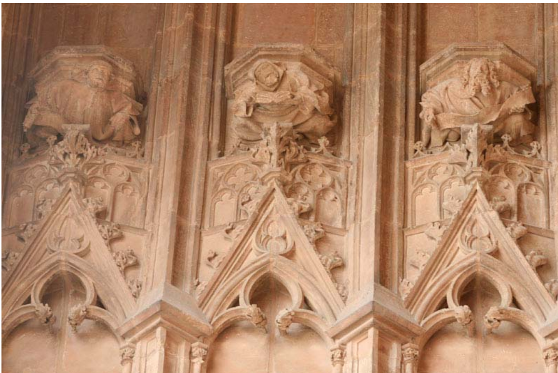
Fig. 14.- Portal del Mirador. Conjunt de mènsules antropomorfes i arcs cecs.