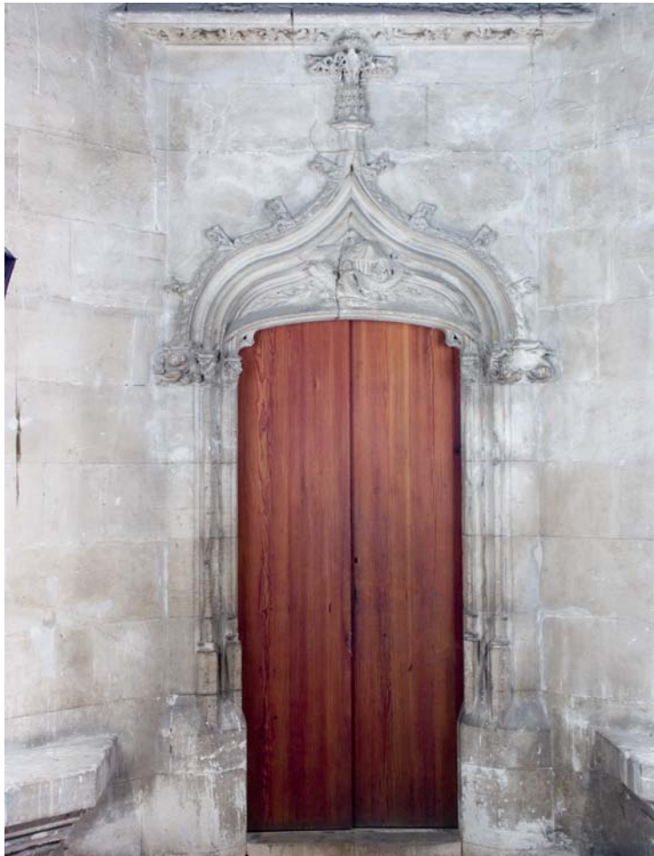
Fig. 37.- Llonja. Interior. Portal d'accés a les torres d'angle.