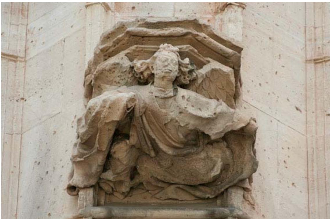
Fig. 24.- Llonja. Exterior. Mènsula.