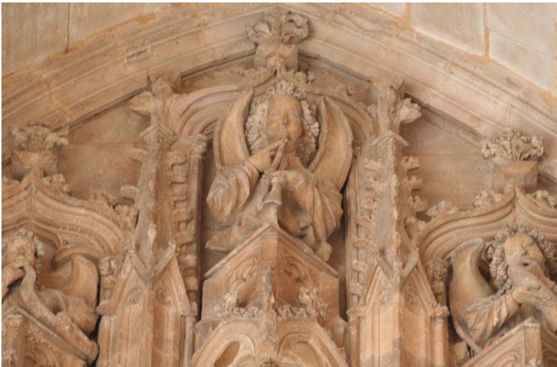
Fig. 15.- Portal del Mirador. Dosseret rematat per un àngel trompeter.