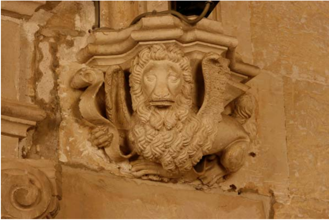
Fig. 9.- Sala Capitulr. Mènsula. Sant Marc.