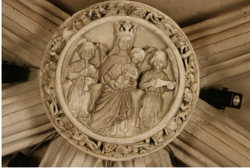
Fig. 1.- capella de la Pietat. Clau de volta