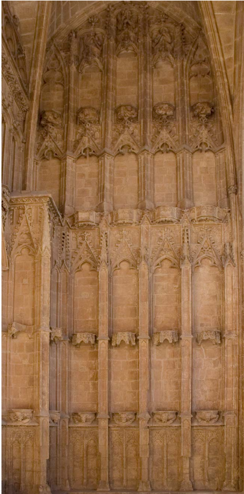
Fig. 10.- Portal del Mirador. Vista general del mur lateral dret.