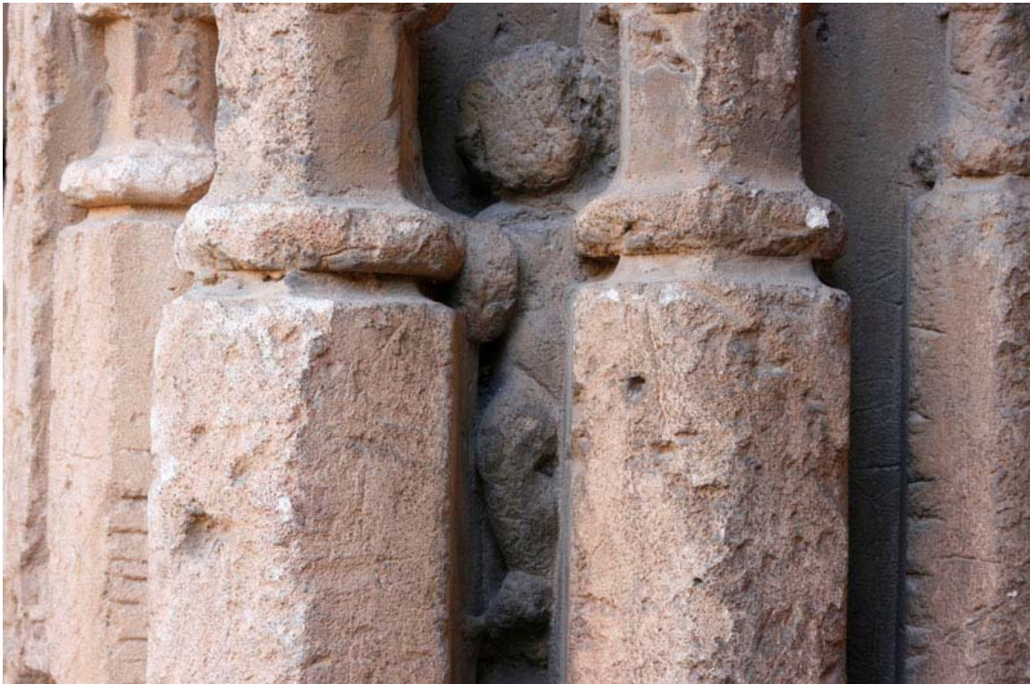
Fig. 28.- Llonja. Exterior. Element de caire antropomòrfic.