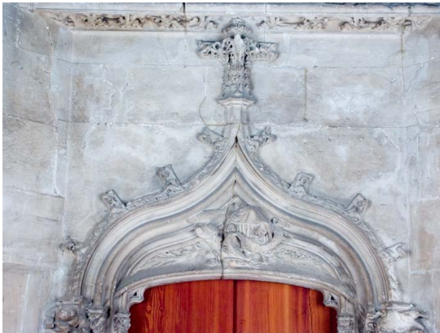
Fig. 38.- Llonja. Interior. Detall.