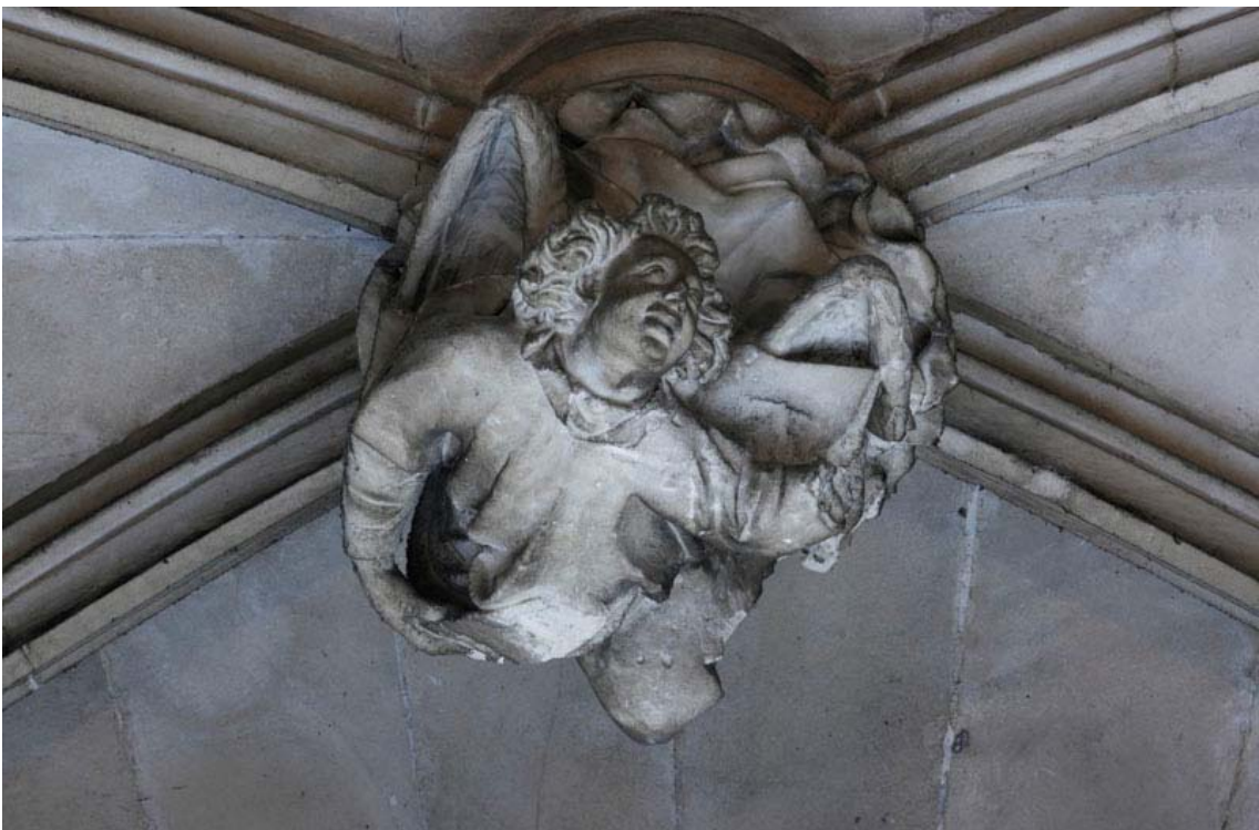
Fig. 36.- Llonja. Interior. Clau de volta de finestral.