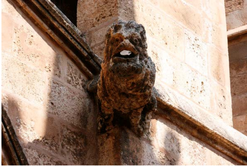
Fig. 19.- Campanar. Gárgola.