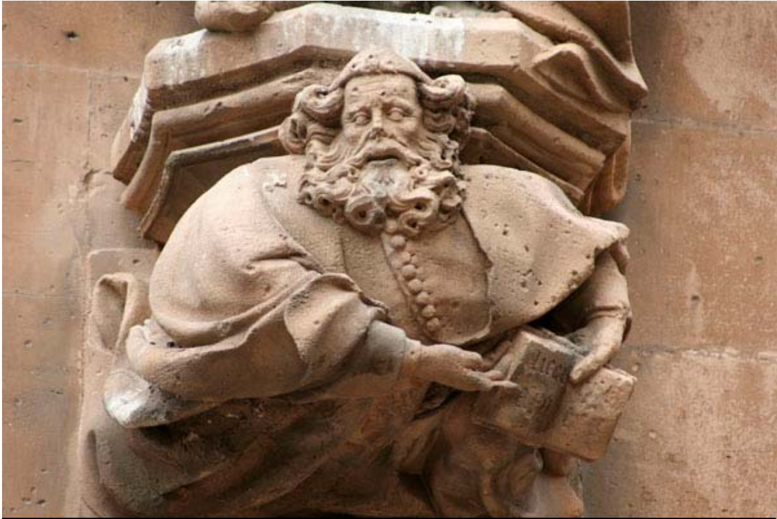
Fig. 25.- Llonja. Exterior. Mènsula.