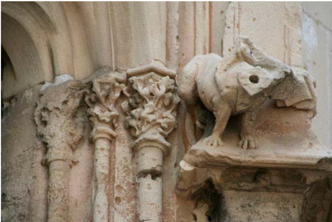
Fig. 22.- Llonja. Exterior. Mènsula de finestral.