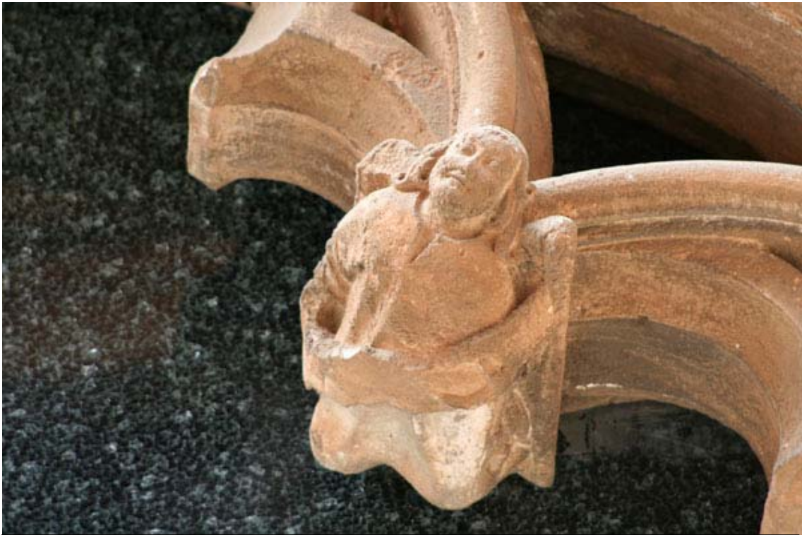
Fig. 23.- Llonja. Exterior. Angelet finestral.