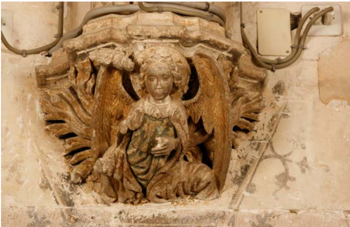
Fig. 6.- Sala Capitular. Mènula. Àngel Anunciació.