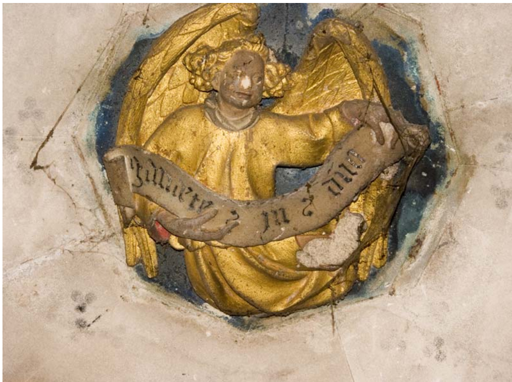
Fig. 32.- Llonja. Interior. Clau de volta d'una torre interior.