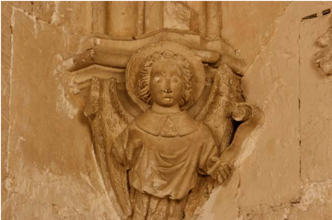
Fig. 7.- Sala Capitular. Mènsula. Sant Mateu.