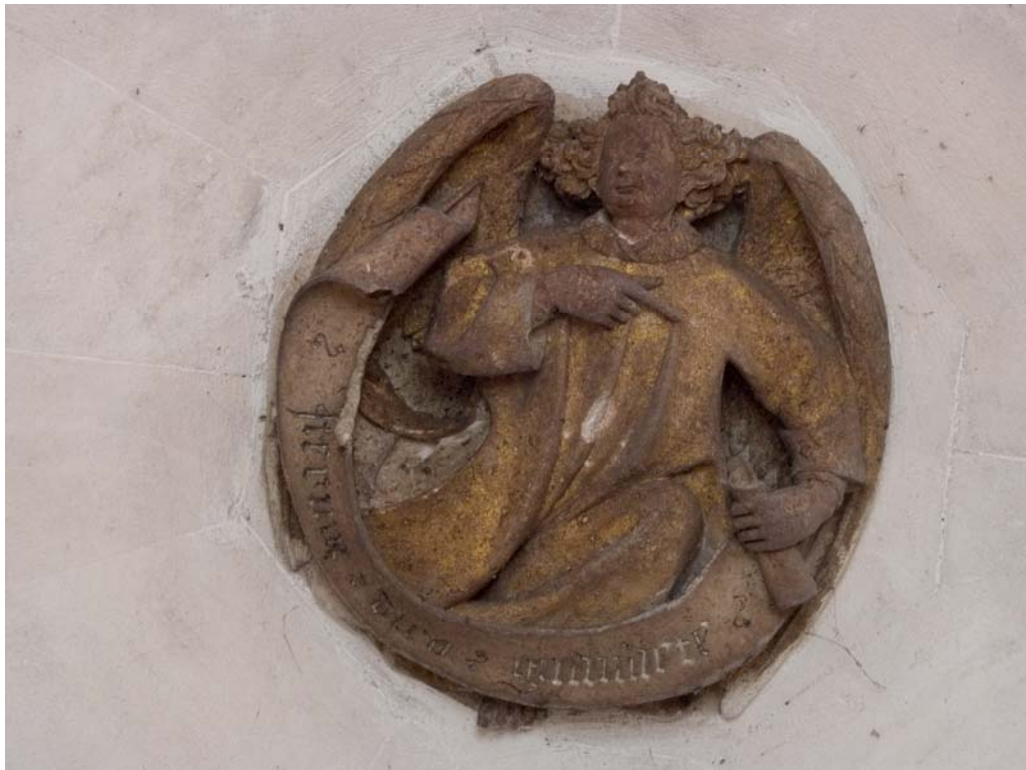
Fig. 31.- Llonja. Interior. Clau de volta d'una torre interior.