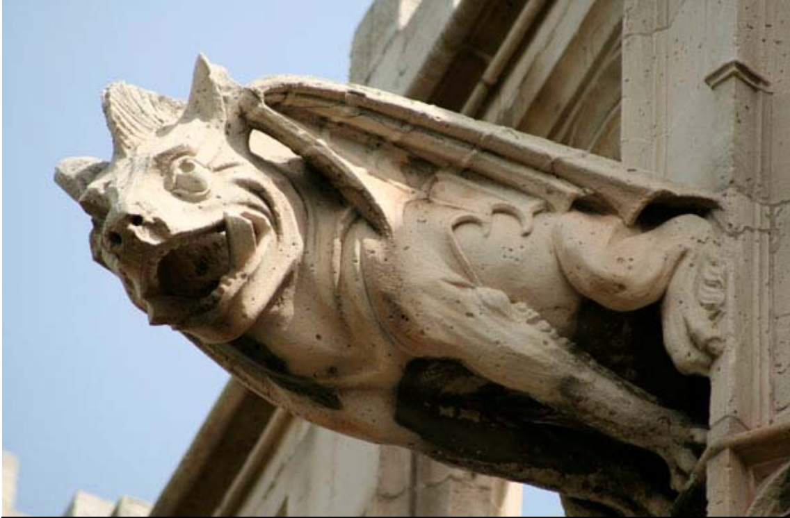
Fig. 29.- Llonja. Exterior. Gàrgola.