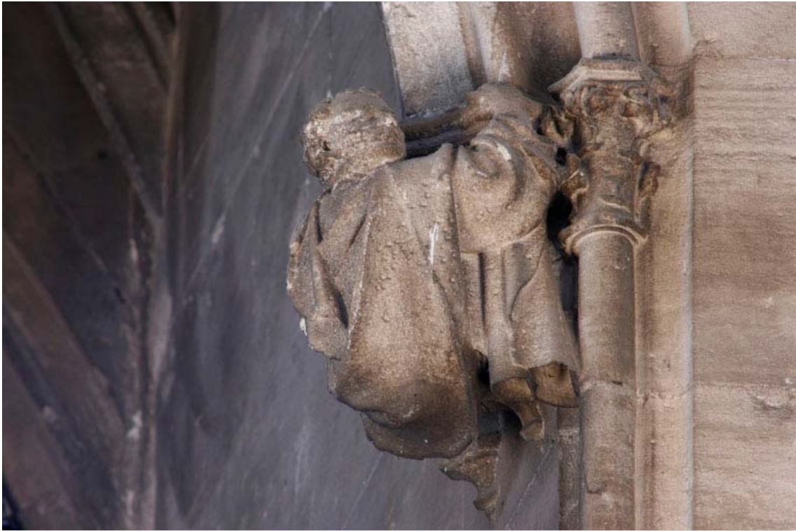
Fig. 35.- Llonja. Interior. Mènsula de finestral.