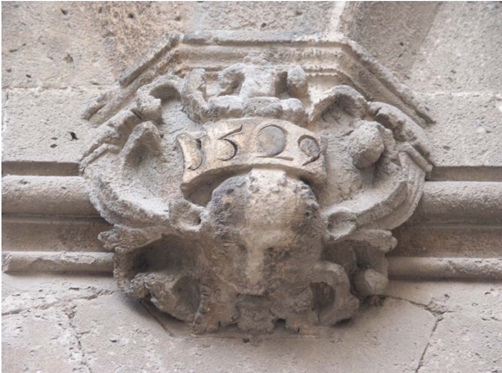
Fig. 21.- Casa de l'Almoina. Mènsula.