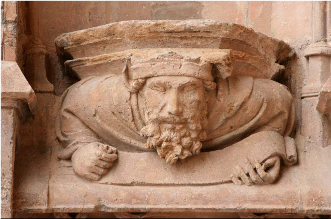
Fig. 11.- Portal del Mirador. Mènsula.