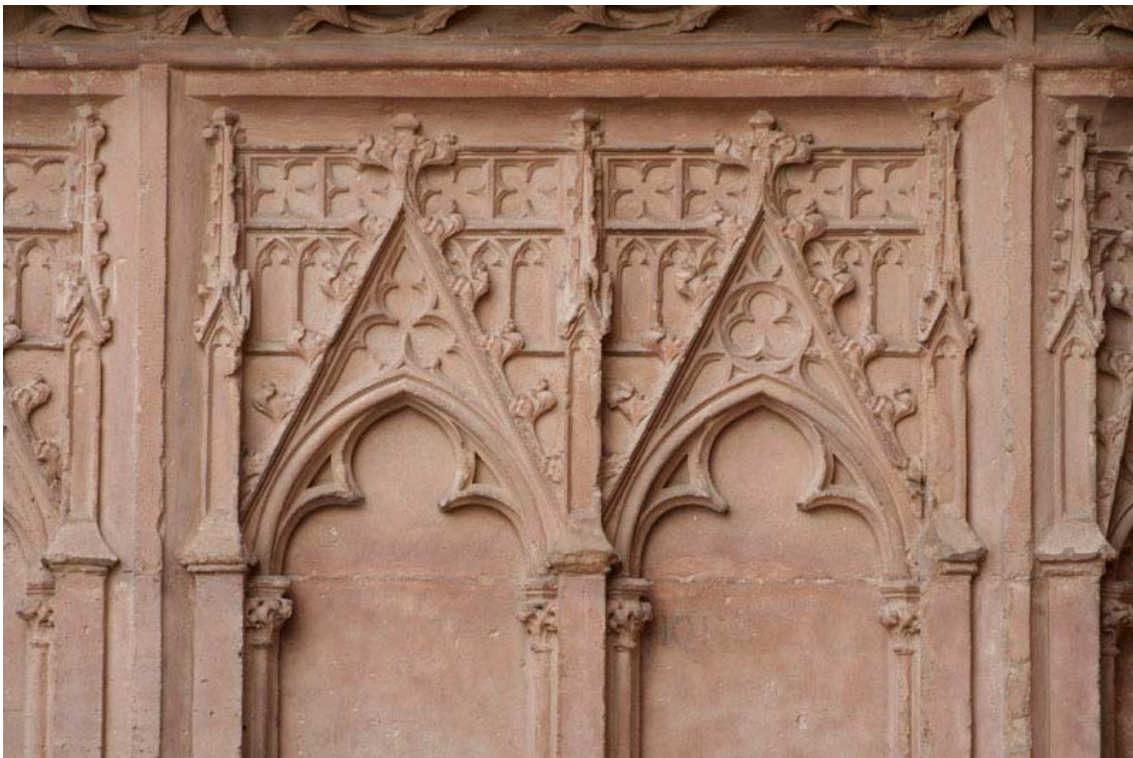
Fig. 13.- Portal del Mirador. Parell d'arcs cecs.