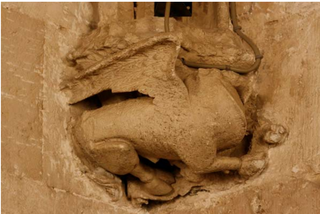
Fig. 8.- Sala Capitular. Mènsula. Sant Lluç.