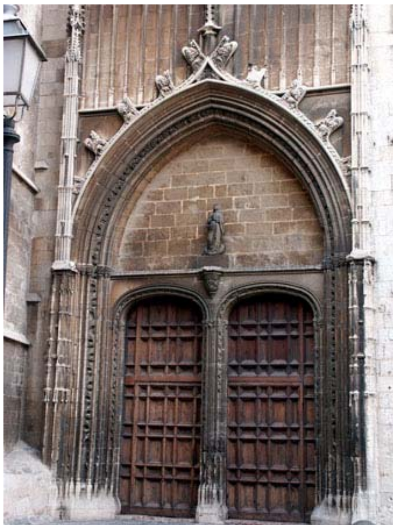
Fig. 17.- Portal de l'Almoina. Vista general.