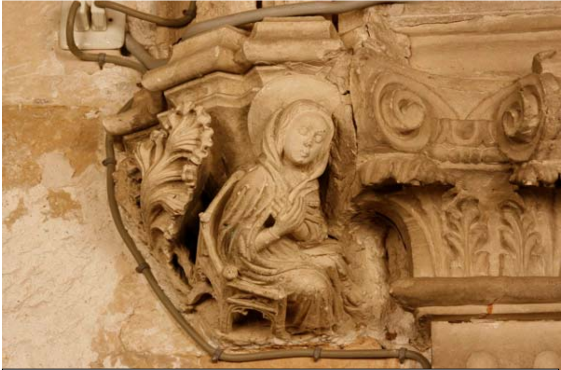
Fig. 5.- Sala Capitular. Mènula. Verge.