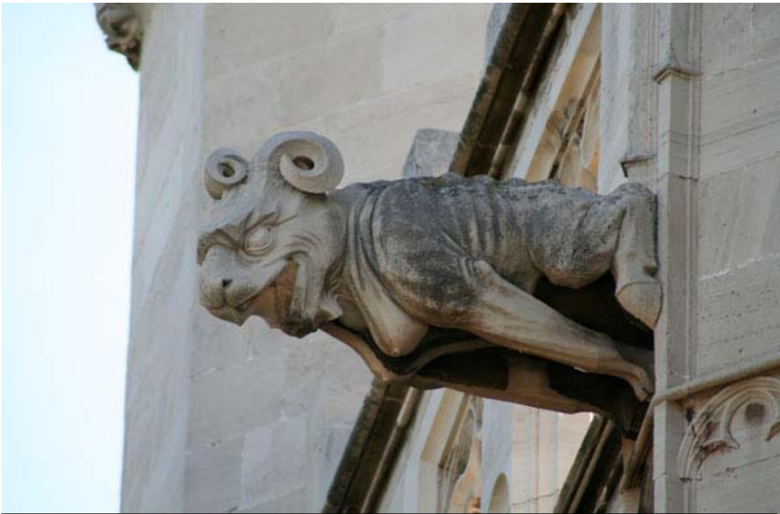
Fig. 30.- Llonja. Exterior. Gàrgola.