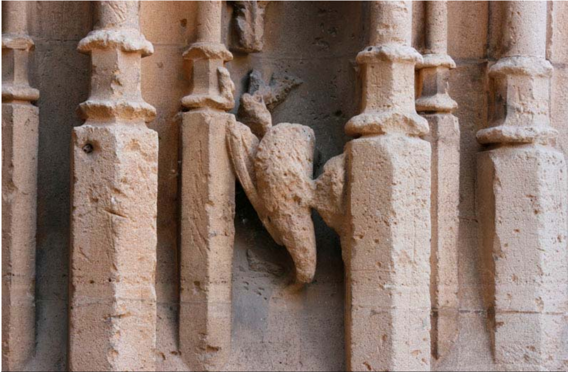
Fig. 27.- Llonja. Exterior. Element de caire zoomorfic.