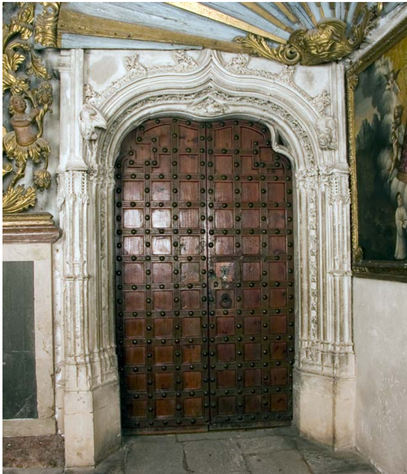
Fig. 2.- Capella de la Pietat. Portal que dóna entrada a la Sala Capitular