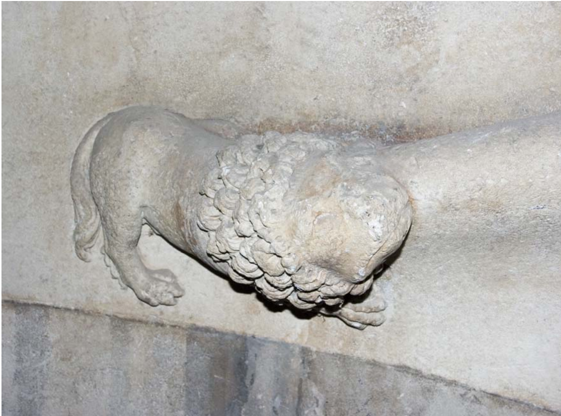
Fig. 33.- Llonja. Interior. Detall de l'arrambador.