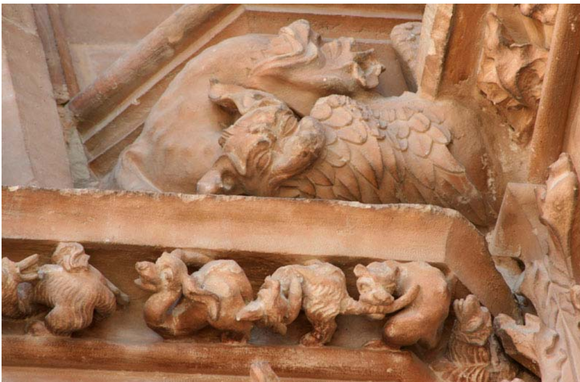
Fig. 16.- Portal del Mirador. Mènsula zoomòrfica i detall de fris amb petis dracs