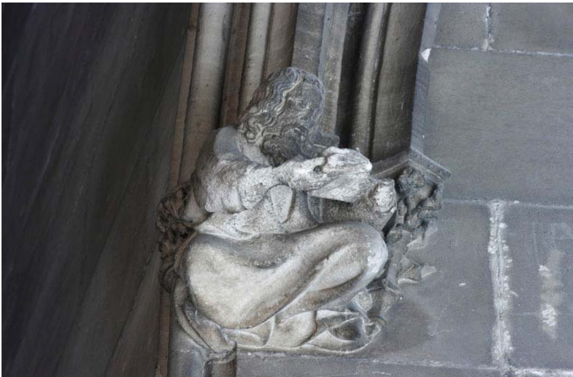
Fig. 34.- Llonja. Interior. Mènula de finestral.