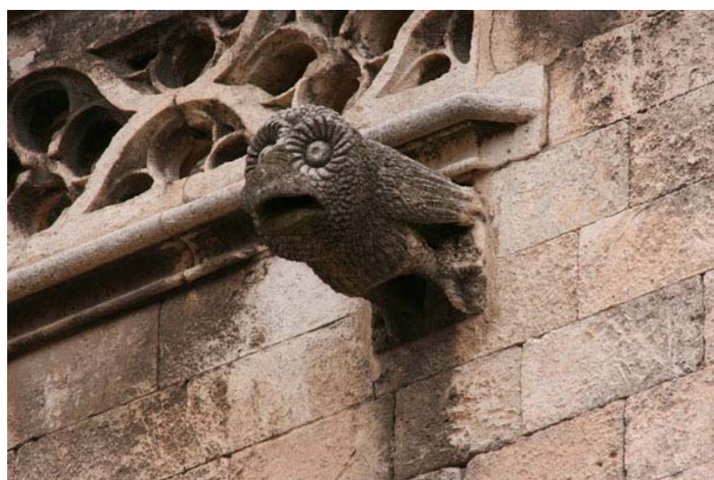
Fig. 18.- Portal de l'Almoina. Gàrgola.