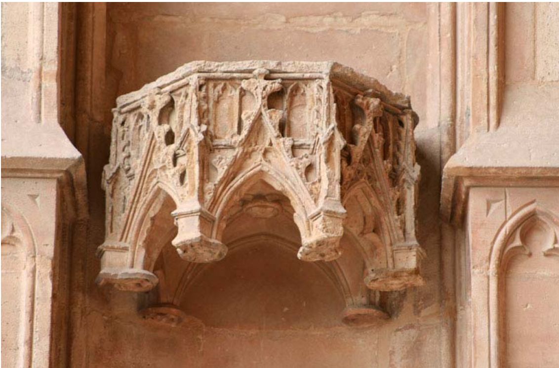
Fig. 12.- Portal del Mirador. Dòsseret.