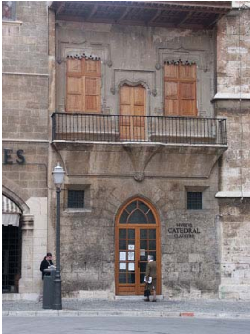
Fig. 20.- Casa de l'Almoïna. Vista general.