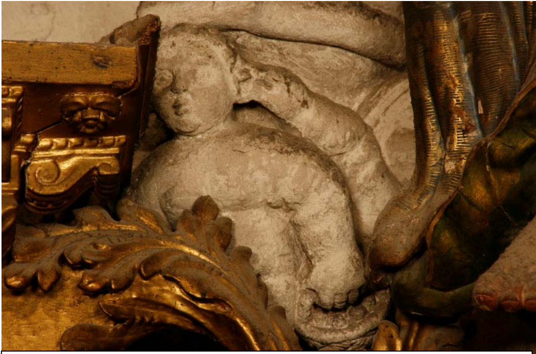
Fig. 3.- Capella de la Pietat. Mènsula.