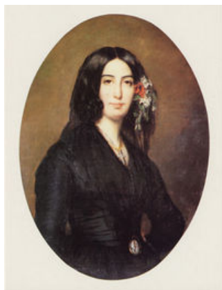
Portrait de George Sand par Auguste Charpentier (1835)

SAND, George, pseudonyme de Dudevant, nom de jeune fille Dupin, Amantine Aurore Lucile, Baronne (1804-1876)