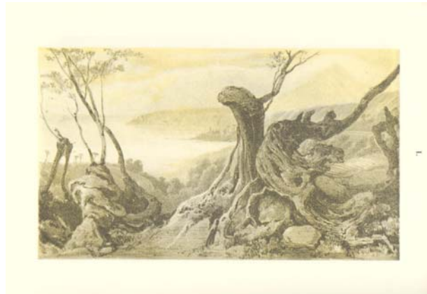
Oliviers dessinés au naturel dans les montagnes, entre Sóller et Valldemossa, Laurens.

Le « sublime » trouva son expression la plus vive dans deux composants importants de ce paysage : l'olivier et l'oranger. Les voyageurs romantiques consacrèrent l'olivier en élément symbole de l'île. Laurens y dédia l'une de ses gravures : la gravure L « Oliviers dessinés au naturel dans les montagnes entre Soller et Valdemusa », la plus réussie comme paysagiste.