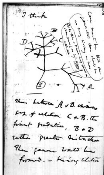
Esquema de Darwin sobre l'evolució i diversificació de les espècies (1837)