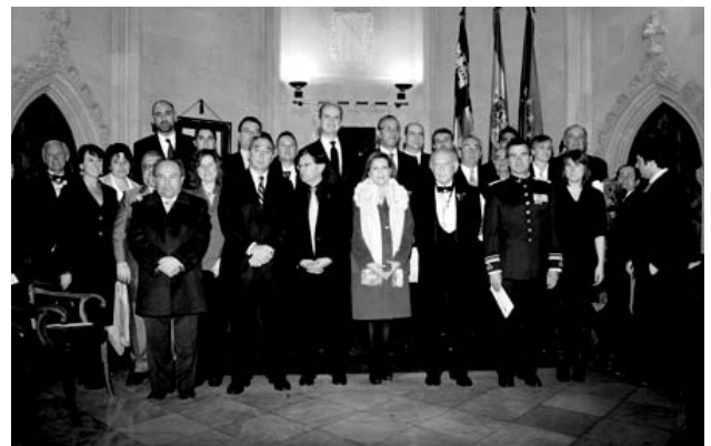
Els premiats amb les autoritats