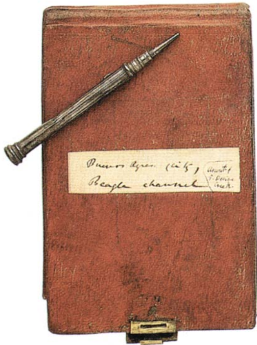
Uno de los cuadernos de viaje de Charles Darwin

completo hasta que Watson y Crick mostraron en 1953 la estructura del ADN en doble hélice que, al desdoblarse, permite la transmisión de los caracteres hereditarios. Los trabajos posteriores llevaron al descubrimiento del código genético, a la evidencia de que todos los seres vivos poseen cadenas formadas por los mismos nucleótidos y a la conclusión de que el código es universal.