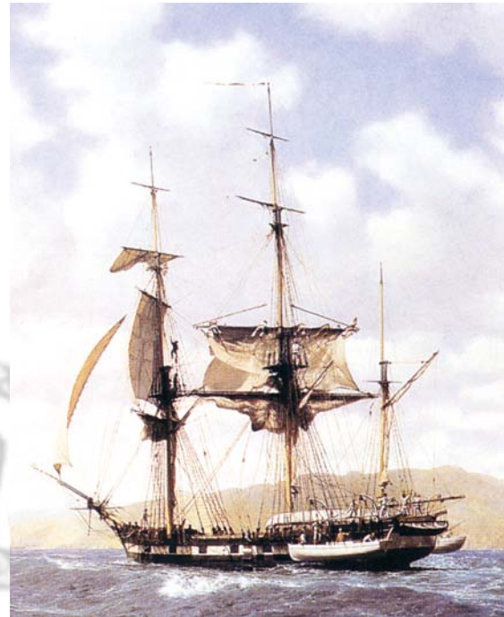
El Beagle, pintado por John Chancellor el 17 de octubre de 1835 frente a las Galápagos

Decíamos más arriba que la variabilidad del sistema de histocompatibilidad permite afirmar que cada hombre es único pero, en realidad, todos los hombres son iguales... y al mismo tiempo diferentes. Así pues, cuando afirmamos que los hombres nacen iguales, no decimos que sean idénticos sino que merecen todos por igual nuestro respeto y tiene derecho a una vida igualmente digna. Tengo la esperanza de que los nuevos modos de vida puedan implicar mañana nuevas conexiones neuronales; es también posible que el avance del conocimiento científico de lugar a diferentes intervenciones en el cerebro que mejoren su capacidad y habilidades. Con el concurso de las nuevas tecnologías el hombre quizás podrá aumentar su