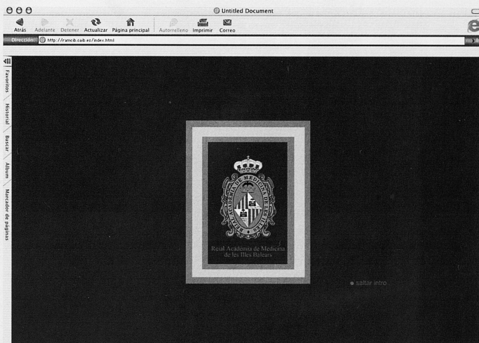
La introducció a l'espai electrònic de la pàgina de la Real Acadèmia de Medicina de les Illes Balears: ramcib.caib.es.

En l'edició tradicional, la distribució de revistes com Medicina Balear es veu condicionada per límits geogràfics perquè, com passa amb totes les publicacions periòdiques impreses, el número de lectors disminueix a mesura que la distància augmenta segons el model conegut com "hipòtesi del paraigües": gràcies a la edició electrònica sorgeix una eina extraordinària de difusió dels treballs i, alhora, una novíssima i eixamplada comunitat lectora que, a través de la xarxa i amb independència de la seva situació geogràfica, accedeix a les nostres pàgines. Per contrapartida, exigeix a les corporacions com la nostra Reial Acadèmia l'adopció d'una perspectiva de gestió que les permeti complir la seva funció de servei públic. Guiada per la llum d'aquesta estrella, Medicina Balear va emprendre l'aventura de crear una edició electrònica amb la pretensió de donar major