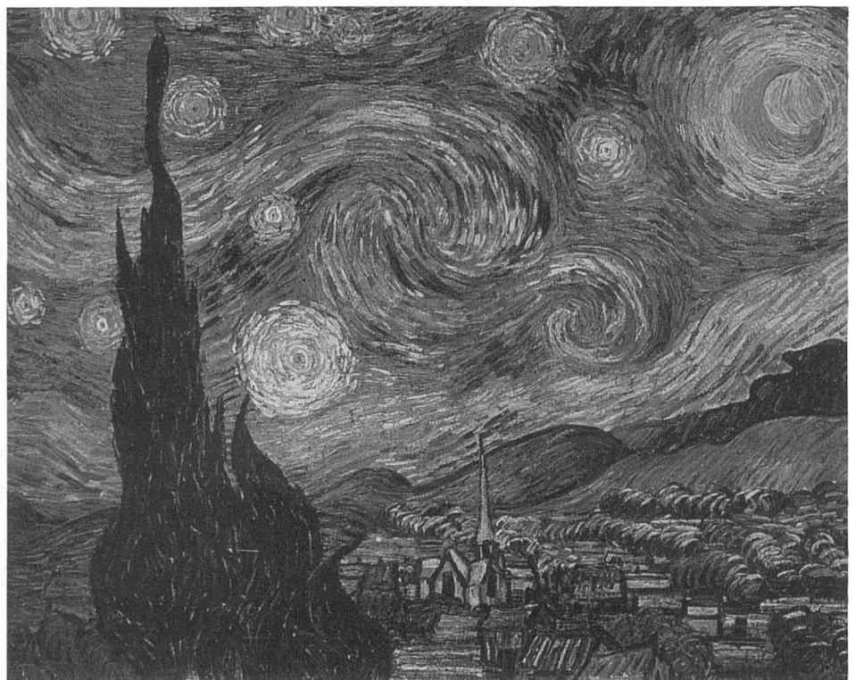
La nit estelada, 1889

Norman Geschwind, brillant neuròleg de la Universitat de Harvard, mort l'any 1984, va descriure, a principis de la dècada dels 1970, les cinc característiques de la personalitat que freqüentment acompanyen l'epilèpsia del lòbul temporal i que actualment es coneixen com la síndrome de Geschwind : hiperreligiositat, hipergrafia, dependència extrema cap a les altres persones, agressivitat i sexualitat alterada. Van Gogh constituiria un exemple d'aquesta síndrome: abans de convertir-se en pintor es va fer missioner protestant, rebent moltes crítiques pel seu excés de zel que fregava l'escàndol. La hipergrafia, la necessitat compulsiva d'escriure i de pintar, estaria clarament demostrada per les innombrables cartes i les dues mil teles i dibuixos realitzats en un curt espai de temps. La dependència excessiva cap als altres la representaria la seva molt intensa relació amb el seu germà Theo i els desesperats esforços per coniar amb Gauguin. Els atacs d'agressivitat estan documentats si bé no foren freqüents i la seva alteració sexual va prendre la forma de períodes d'hipersexualitat i d'hiposexualitat.