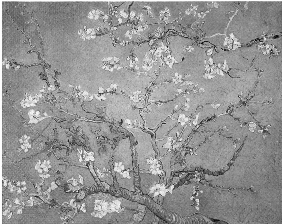
Branques d'ametler en flor, 1890.