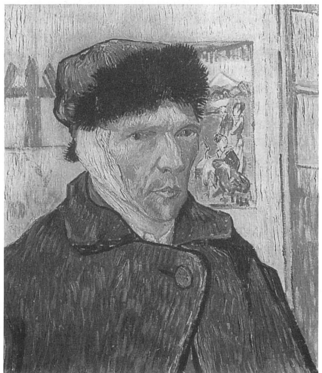
Autorretrat amb el cap embenat, 1889.

Els fets es coneixen prou bé gràcies a la detallada descripció, naturalment la seva versió, de Gauguin. «Quin dia, Déu meu! A posta de sol, després d'un pobre berenar, vaig sortir a fer una volta. Acabava de creuar la plaça de Victor Hugo quan vaig sentir, darrera meu, el só familiar d'unes passes, ràpides però irregulars. Vaig girar just en el moment en què en Vincent es llançava sobre mi amb un raor obert a la ma. L'expressió de la meua mirada degué ésser terrible perquè es va aturar i, acotant el cap, va córrer cap a la casa... Vaig llogar una habitació a l'hotel més proper i allí vaig passar la nit, on, tens com em trobava, vaig trigar a agafar la son. Em vaig despertar a les set i mitja... Vaig trobar un grup de gent a la porta de la casa amb diversos guàrdies i un comisari. Resulta que van Gogh, en tornar a la casa, immediatament es va tallar l'orella. Degué tardar bastant en controlar l'hemorràgia, perquè, l'endemà, trobàrem diverses tovalloles brutes de sang pel terra de les dues cambres d'abaix. Quan es va sentir millor, amb una boina basada ben esbiaixada va marxar a una casa de cites i li va donar a la portera l'orella dins un sobre, curiosament neta. Aquí hi ha, va dir, un record meu. De retorn a la casa, es va ficar dins el llit i es va adormir... Jeia en el llit, completament cobert per les flassades, arraulit,