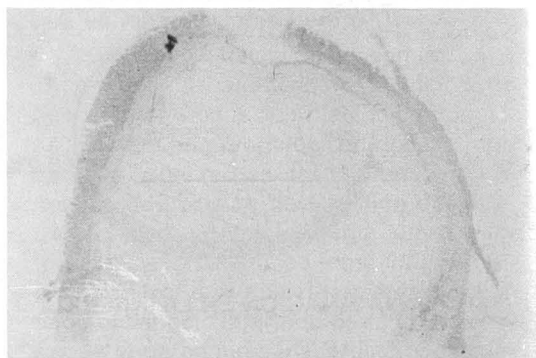
Figura 2 Preparación anatomopatológica del ariete de invaginación, mostrando un lipoma submucoso y cambios isquémicos en la mucosa intestinal.