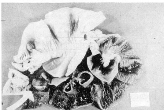
Figura 1 Pieza quirúrgica de resección segmentaria ileal. Se aprecian los segmentos invaginante e invaginado, con signos de infarto hemorrágico.

Hemos revisado las oclusiones intestinales tratadas en el Hospital Son Dureta de Palma de Mallorca en los cuatro últimos años, basándonos en los datos obtenidos a partir de la Unidad de Documentación Clínicas que codifica las atenciones hospitalarias mediante la clasificación de enfermedades CIM9-MC. Encontramos un total de 316 oclusiones del adulto, de las cuales se debieron a intususcepción (1,26%). Estos cuatro casos fueron trata-