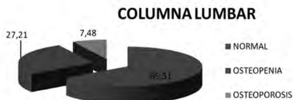
Gráfica 4. Porcentaje de trabajadores según DMO en columna lumbar