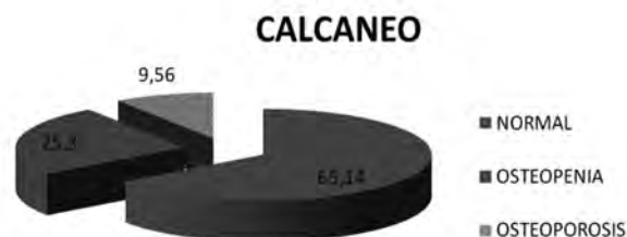
Gráfica 3. Porcentaje de trabajadores según DMO en calcáneo

die (gráficas 3,4 y 5), de manera que en calcáneo es de un 34,86% (9,56% de osteoporosis y 25,3% de osteopenia), en columna lumbar es de un 34,69% (7,48% de osteoporosis y 27,21% de osteopenia), y finalmente en cuello de fémur es de un 34,01% (2,72% de osteoporosis y 31,29% de osteopenia).