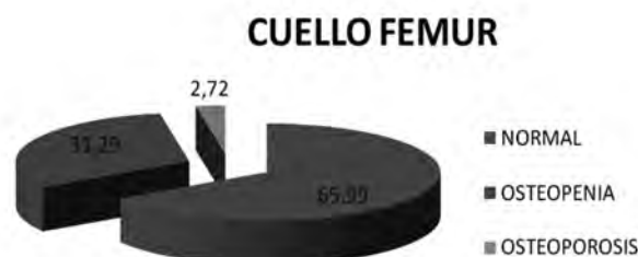
Gráfica 5. Porcentaje de trabajadores según DMO en cuello de fémur