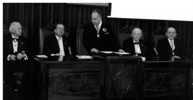
Mesa presidencial de l'acte a La Coruña