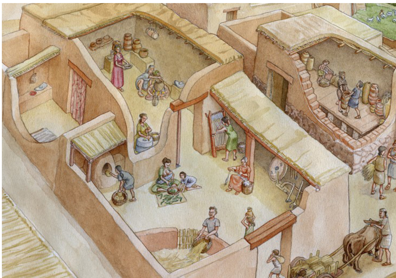
Figura 1. Reconstrucció d'una casa ibera (font: Pastwomen.net. Il·lustració de Miguel Salvatierra).