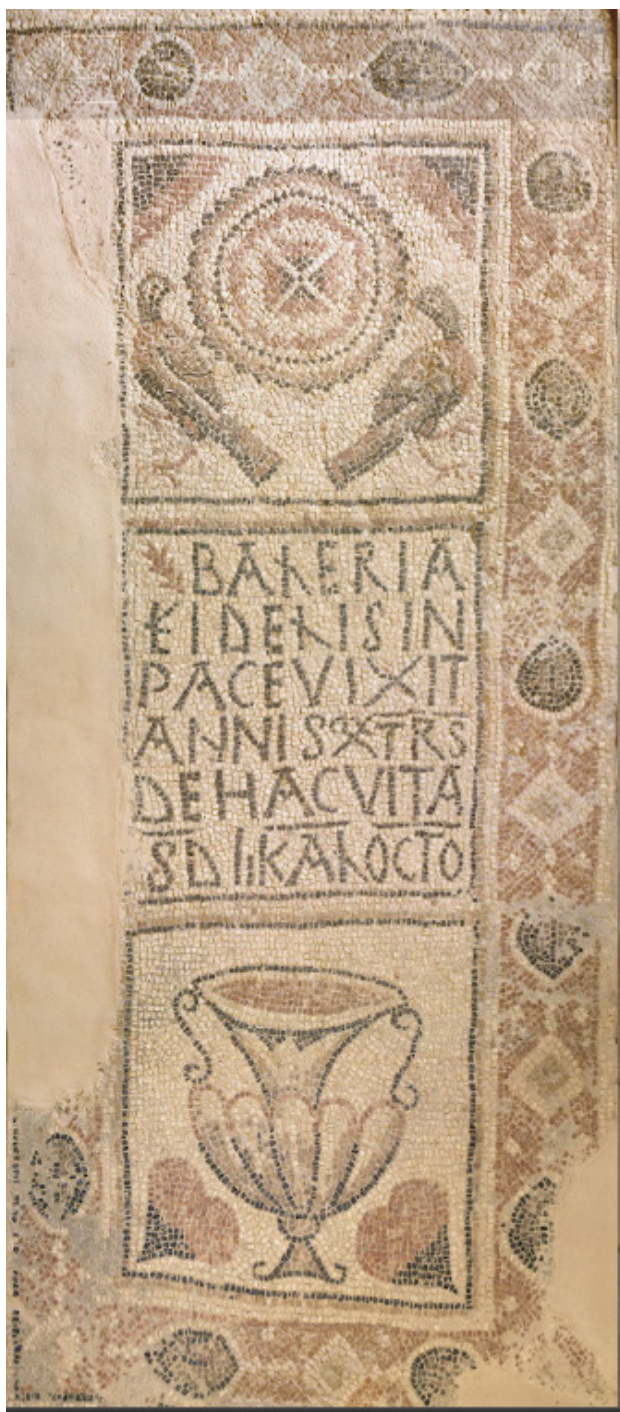
Figura 4. Làpida sepulcral del segle VI dC.