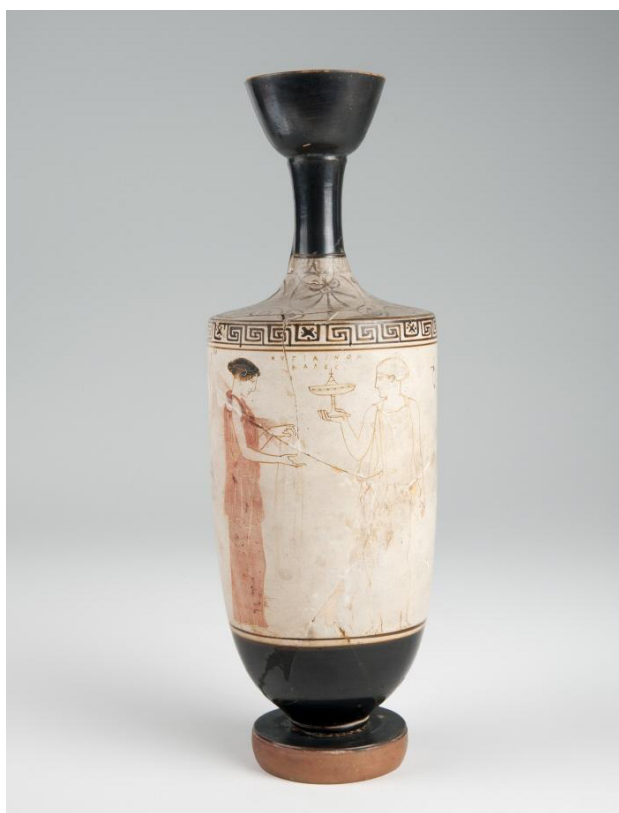
Figura 3. Escena de gineceu. Pintor d'Aquil·les, Àtica, 440 aC.

per parlar sobre cada resposta i posar-se d'acord i 5 minuts per escriure la resposta basant-se en els coneixements compartits amb els companys. Els alumnes han de completar una fitxa artística sobre cada una de les imatges i completar-ne els ítems següents: material i estil, descripció (on té lloc, quina activitat fan?), funcionalitat (on us imaginau que estaven situades? Quina funció creis que tenien?). Posteriorment, i també en equip, els alumnes han de respondre dues qüestions amb l'objectiu de fer-los reflexionar sobre els diferents rols de la dona grega observats als diferents suports: creis que totes les dones feien les mateixes activitats i es dedicaven al mateix? Podeu relacionar la representació d'aquestes dones amb un estatus concret?