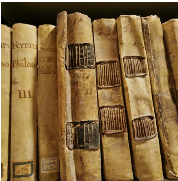
Figura 6. Detall d'alguns dels volums antics.