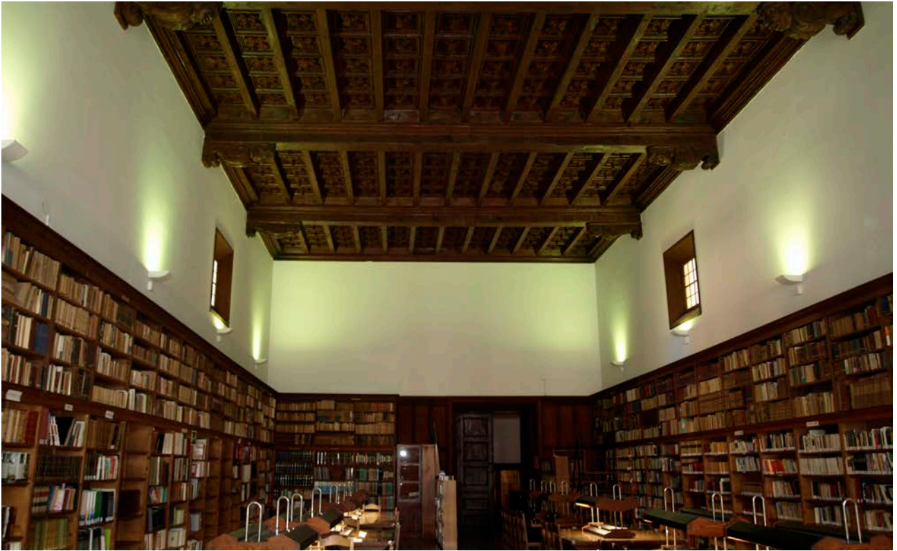
Figura 1. Vista general de la biblioteca del convent de Sant Francesc d'Assís de Palma.