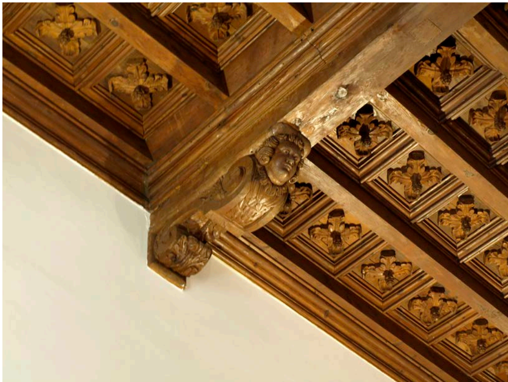
Figura 2. Detall de l'enteixinat