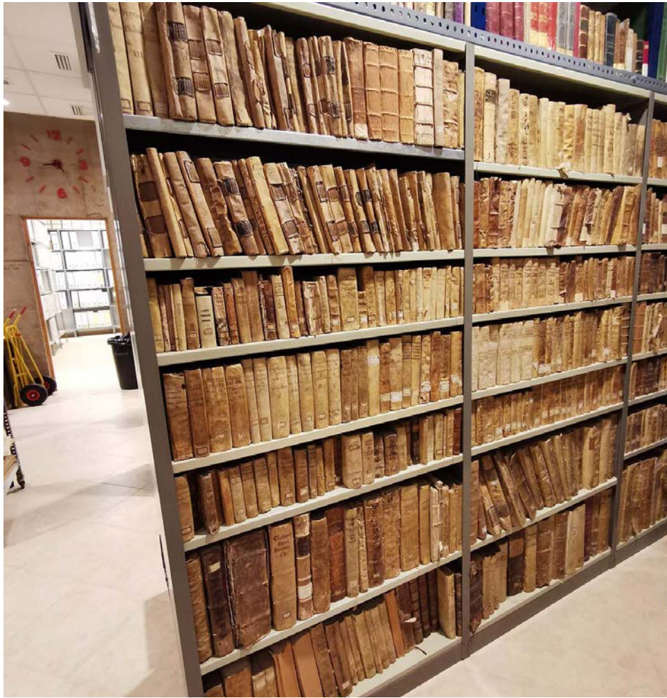
Figura 5. Fons antic de la biblioteca conventual conservat a l'Arxiu Provincial TOR Espanya