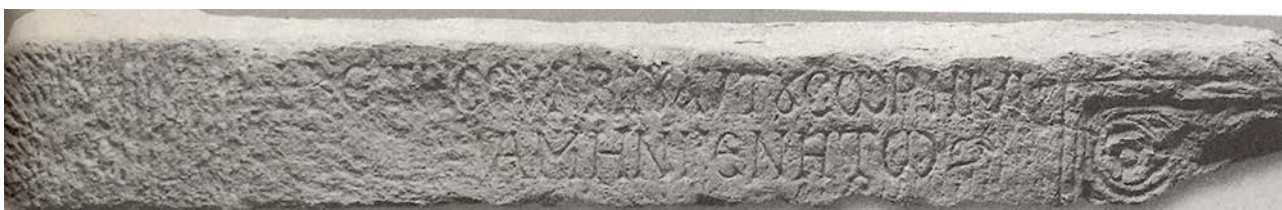
Figura 2. Cagliari, epigrafe di Unuspiti e Sorica (da Coroneo 2000).