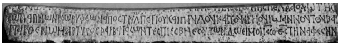
Figura 8. Assemini, epigrafe di Nispella (da Delogu 1988).

Il panorama appena accennato sulle epigrafi mediobizantine in Sardegna sfortunatamente apre più interrogativi che non elementi utili a una chiarificazione. Gli ultimi due materiali lapidei citati sono probabilmente gli unici indizi di una forte autonomia delle figure femminili. Infatti, se negli altri documenti epigrafici le donne consorte sono associate al potere maschile, in questo caso è la stessa Nispella a rivolgere una richiesta di intercessione per la remissione dei peccati e, verosimilmente, lo fa attraverso una commissione