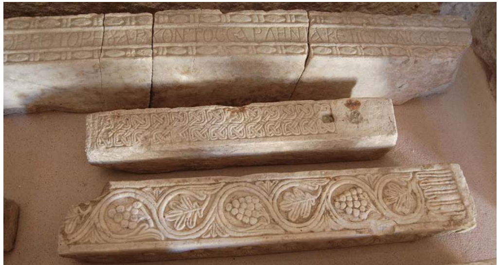
Figura 6. Assemini, epigrafe di Torcotorio e Getite (Andrea Pala).

l'altezza delle lettere incise è di cm 4,5. 59 L'ornato a fuseruole che delimita l'epitaffio trova riscontri simili in gran parte della produzione plastica del Sud Italia. Tuttavia, il confronto maggiormente stringente si ha con le fuseruole che riquadrano i pilastri di protiro di Sant'Aspreno di Napoli, ascrivibili alla seconda metà del X secolo. 60 Anche in questo caso, l'iscrizione è introdotta