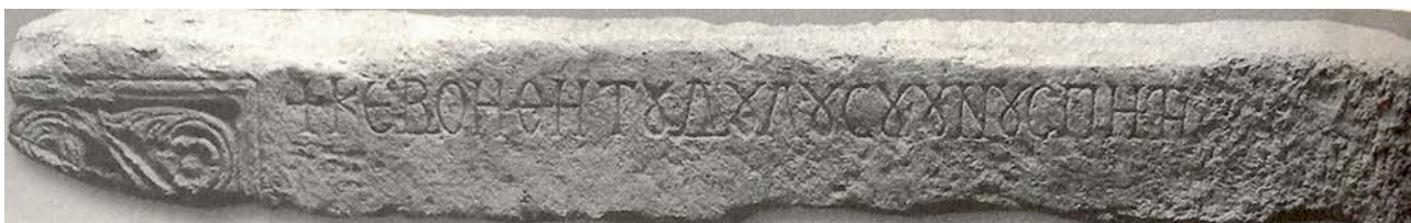
Figura 1. Cagliari, epigrafe di Unuspiti e Sorica (da Coroneo 2000).

Seguendo l'impostazione cronologica proposta da Roberto Coroneo, l'iscrizione più antica, fra le sei rinvenute, è quella proveniente dalle rovine della chiesa di Santa Sofia, nel territorio tra i centri di Decimoputzu e Villasor, in provincia di Cagliari 31 (fig. 1-2). I marmi furono prelevati nelle adiacenze della struttura ecclesiastica poco prima del 1860. 32 L'ultima collocazione segnalata è quella dei depositi del museo Archeologico Nazionale di Cagliari. Il manufatto litico, che originariamente si presentava come un unico pezzo, fu rinvenuto scisso in due parti, entrambe in forma di parallelepipedo, di colore bianco e aventi all'incirca la stessa misura