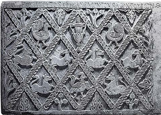
Figura 3. Napoli, epigrafe di Campulo e Costantina (da Coroneo 2000).

marmi epigrafici sarebbero parte integrante di un più ampio arredo liturgico a carattere dedicatorio che taluni studiosi mettono in relazione con le tombe a camera interrata rinvenute nel territorio tra Villasor e Decimoputzu, sostenendo la teoria di un possibile legame con l'arrivo di gruppi di cultura greco-orientale. 45 Tutti questi elementi messi in relazione tra loro testimoniano una possibile continuità di vita nel territorio, abitato da gruppi i cui esponenti, di origine bizantina, costituirono una comunità con ruoli anche nell'esercito. Da questi si sarebbe sviluppata successivamente la civiltà giudicale. 46 Senza dubbio le epigrafi, i possibili elementi d'arredo litico e le sepolture rimandano a un ambito