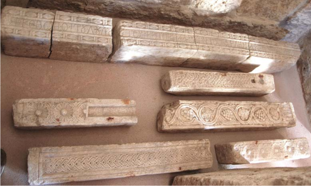
Figura 5. Assemini, epigrafe di Torcotorio e Getite (Andrea Pala).