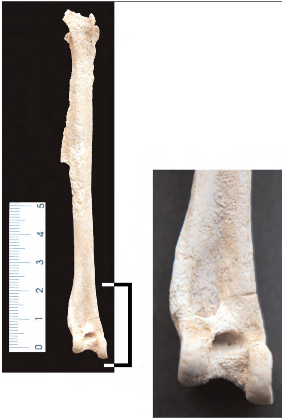
Fig. 7. Hueso de cormorán con marca de carnicería.