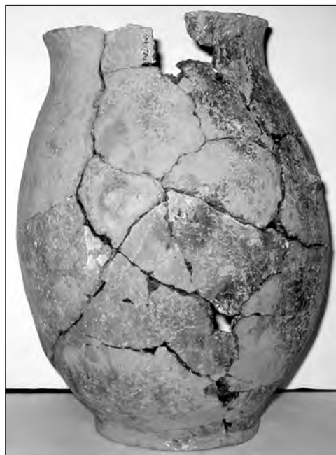
Figura 4. Contenedor cerámico funerario (conjunto número 158, foto)