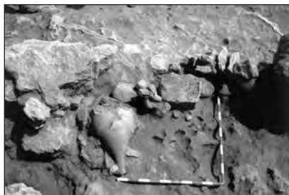
Figura 3. Enterramientos de la segunda zona

Una segunda zona de enterramiento es la que corresponde a las unidades estratigráficas números 54 y 57, en la cual también encontramos un acondicionamiento del túmulo para situar los contenedores funerarios. En este caso la intervención en la estructura del túmulo consiste en el vaciado del relleno existente entre dos de las estructuras murarias que forman un escalón del túmulo. Aquí se localizaron tres urnas de arenisca, una ánfora PE-24, supuestamente también utilizada como contenedor funerario y restos de la parte inferior de otra ánfora que, a causa de su fragmentación, se desconoce su uso. A diferencia de la anterior zona, en ésta no se puede hablar de un uso continuado por la ausencia de una secuencia estratigráfica clara. En esta zona no se encontró ningún tipo de material asociado a estos contenedores funerarios.