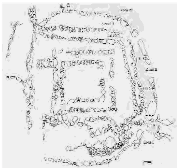
Figura 1. Planta del Túmulo de Son Ferrer: Localización de los enterramientos

El túmulo de Son Ferrer se organiza a partir de una estructura maciza y elevada, construida a base de diferentes líneas murarias concéntricas, que le dan una apariencia escalonada. Formando parte del cuerpo central se localizan dos estructuras cuadrangulares concéntricas embutidas la una en la otra, entre estos elementos arquitectónicos se dispone un relleno de bloques irregulares de arenisca que le otorga una gran solidez a todo el conjunto. Su función original parece ser ritual, al igual que el resto de túmulos, aunque en torno al siglo II a. C. pierde su función primigenia y se convierte en una necrópolis en donde se han localizado abundantes restos de inhumaciones infantiles.