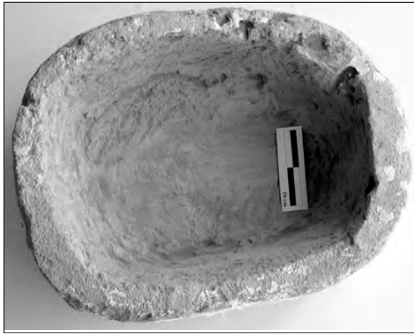
Figura 6. Urna prismática (conjunt 187).

forma cilíndrica y de menor tamaño que las demás. El resto, aunque dos de ellas están fragmentadas, permiten identificar una forma prismática. En el interior de una de las rectangulares (número de conjunto 187) se encontró un trozo de arenisca caído e integrado en el sedimento interno, lo que nos permite apuntar que pueda corresponder a una tapadera. El contenido de las dos urnas de la primera zona, entre ellas la cilíndrica, fue excavado y analizado en el laboratorio.