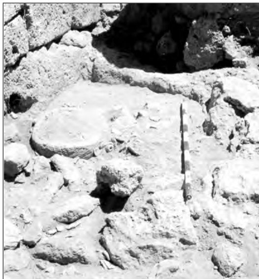
Figura 2. Urna de arenisca (conjunto número 187)

En una tercera secuencia arqueológica, se puede apreciar un nuevo recorte, pero esta vez en la roca madre, donde hay un acceso a una cueva que se encuentra debajo del Túmulo. Aquí se encontró una urna de arenisca rectangular (número de conjunto 187), falcada por piedras, junto a la que apareció un cráneo de cánido de pequeño tamaño. Respecto a éste, podemos decir que, J. Coll Conesa (1995) indica que en Son Ferrandell (Valldemossa), aparecen restos óseos infantiles y de perros en un talayot, aunque según el autor no parece que tengan relación con ningún acto ritual. La ausencia de más datos nos priva de plantear una hipótesis sobre un posible ritual asociando ambos tipos de restos. Los materiales arqueológicos de esta tercera secuencia sellan y amortizan la entrada de la cueva.