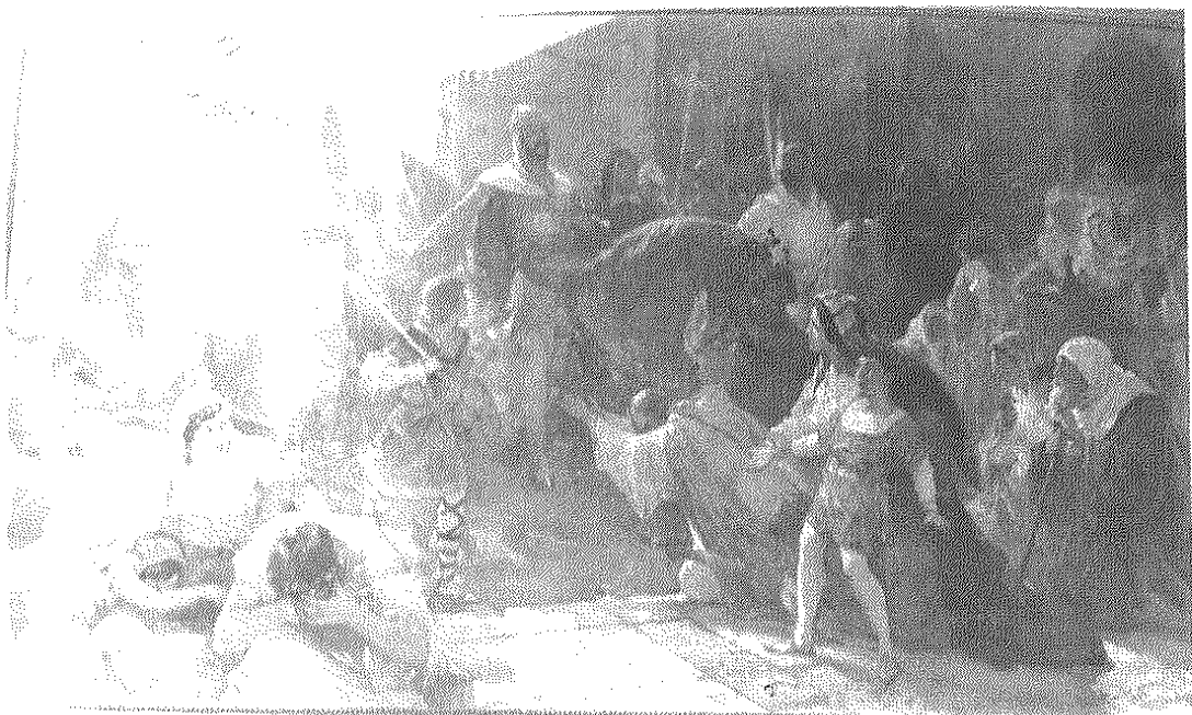
R. Ancker mann: «Rendición del Walí de Mallorca a Jaime I» (1897).

de dar el alto; a la izquierda, el viejo monarca musulmán, cabizbajo y con los brazos cruzados delante el pecho, indica su sumisión; detrás de él, cuatro sarracenos conforman esta parte del cuadro, uno de ellos de rodillas y en escorzo parece haber sido tomado del cuadro de Juan Mestre visto con anterioridad.