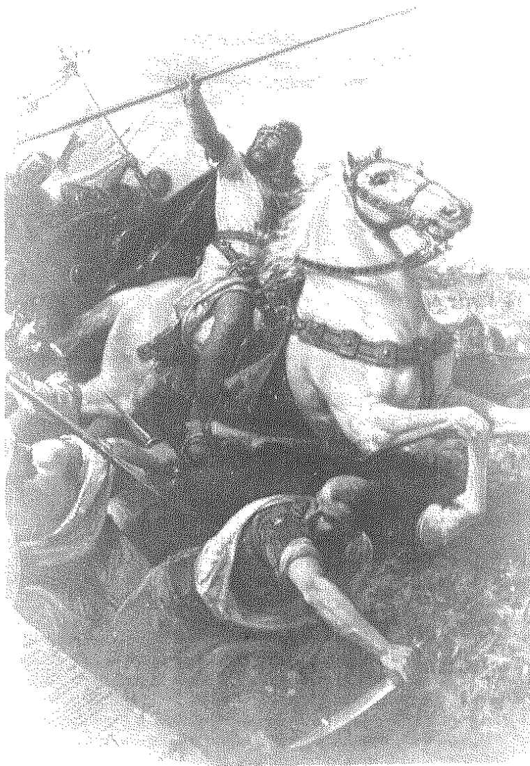
R. Anckermann: «Bernardo de Torrella en el desembarco de Santa Ponsa en 1229» (1887).