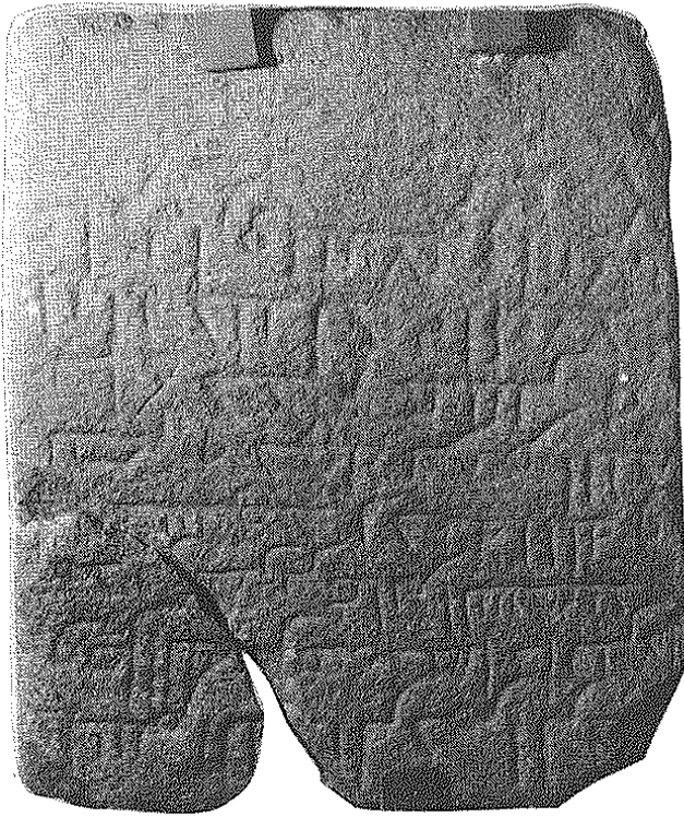
CACERES: INSCRIPCION 3

actuado con uniformidad y no dificulta grandemente la interpretación.