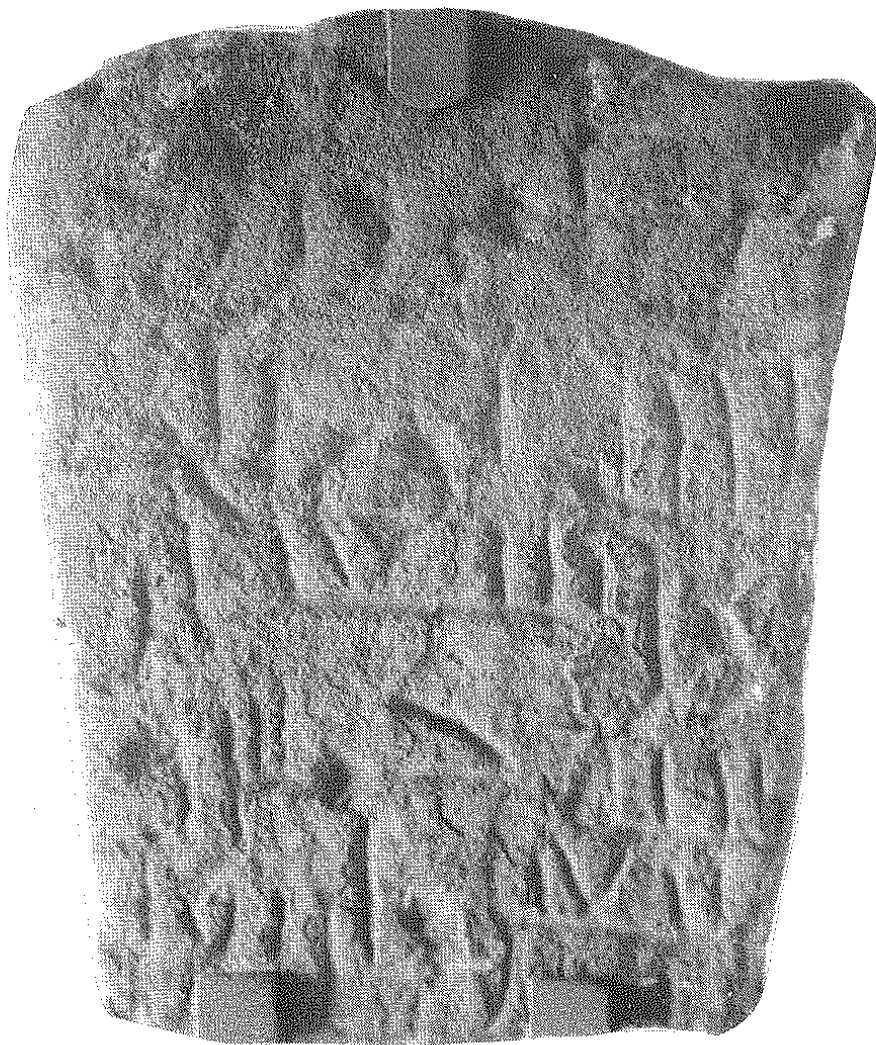
CACERES: INSCRIPCION 1