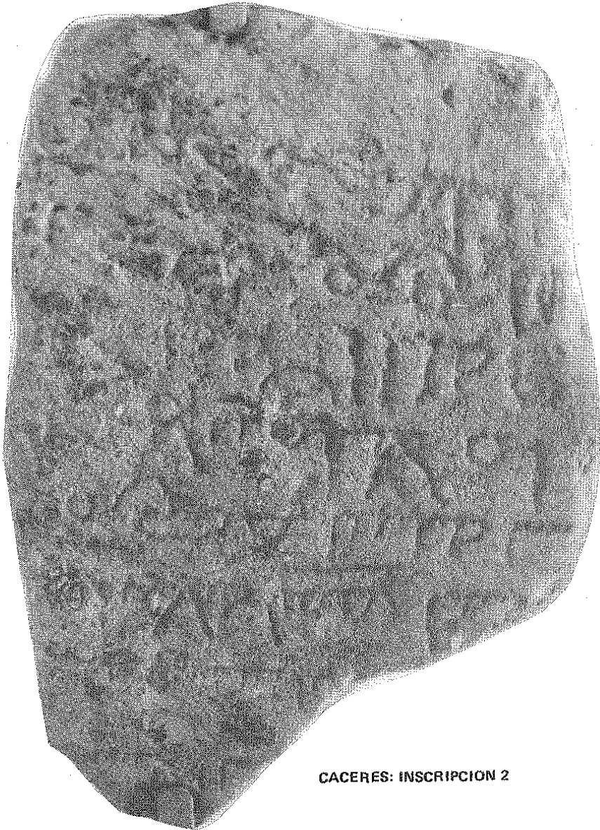
CACERES: INSCRIPCION 2

CONCLUSION: Lápida o estela funeraria de un personaje desconocido que falleció en un día indeterminado del mes de Šabān del año 475 H, que corresponde al año 1082 del cómputo cristiano.