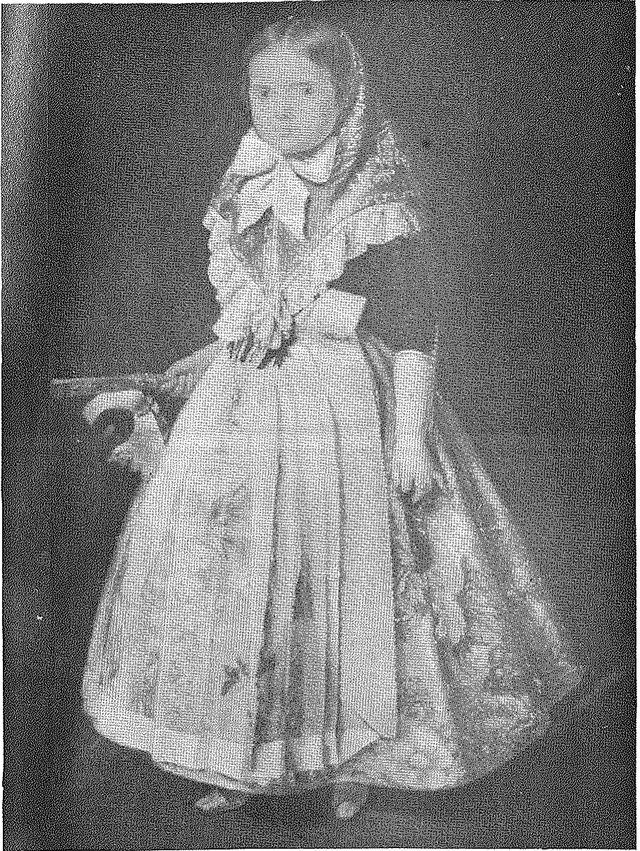
Retrato de niña