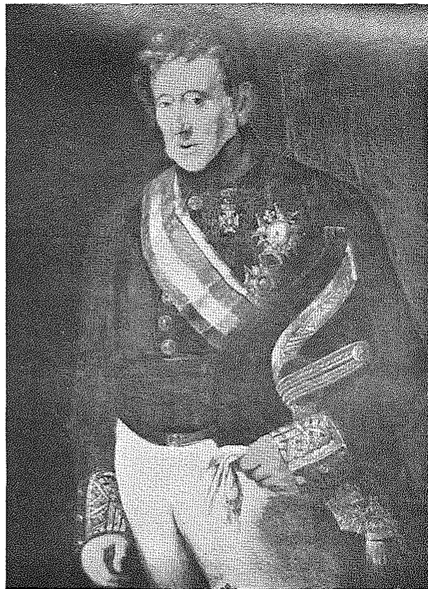
Retrato del Conde de Montenegro, 1848