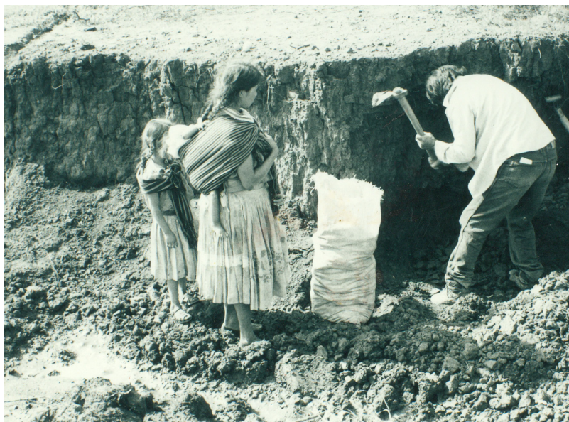
Figura 2. El artesano obtiene el barro directamente del manto arcilloso, utilizando azadón y pala, con ayuda de la esposa.

La técnica más común para dar forma a las vasijas es la del molde cóncavo compuesto por dos mitades verticales (Williams 1994a: fig. 15), que tiene una difusión geográfica limitada al norte-centro de Michoacán y a una pequeña porción en la parte occidental del Estado de México (Foster 1967: 115). Esta técnica se emplea principalmente para la elaboración de cántaros, y consiste en hacer una “tortilla” de barro, misma que se parte en dos mitades que se colocan en cada uno