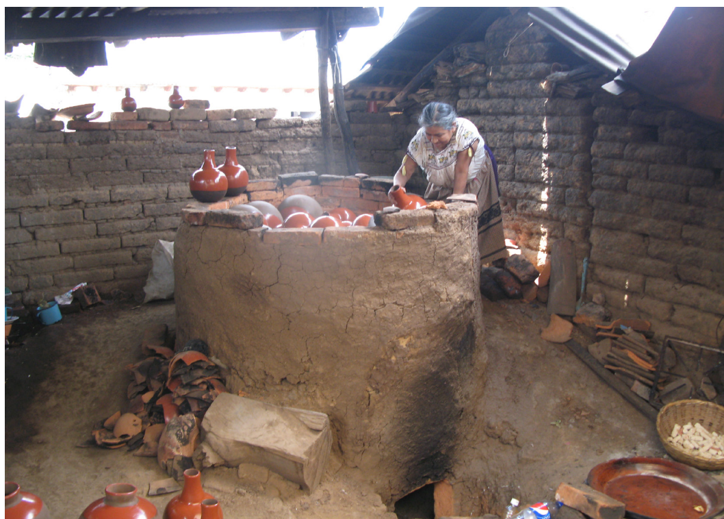
Figura 5. Horno para cocción de las piezas de cerámica en un hogar de alfareros en Huáncito.

Al horno le caben seis docenas de cántaros medianos, los que tardan en quemarse diez horas aproximadamente, y requieren de 1 o 2 cargas de leña, de preferencia de pino. Anteriormente la leña la compraban a gente que la traía de Zopoco o de Tanaco, pueblos de la Cañada (Figura 1), pues como señalamos en el estudio original “en Huáncito el bosque ya está muy retirado del pueblo” (Williams 1994a). La leña era transportada a lomo de burro o de caballo, actualmente la traen de varios pueblos de la Cañada en vehículos de motor. El consumo de este tipo de combustible es considerable, sobre todo porque aparte de los hornos de alfarero, también las cocinas dependen de leña para preparar los alimentos.