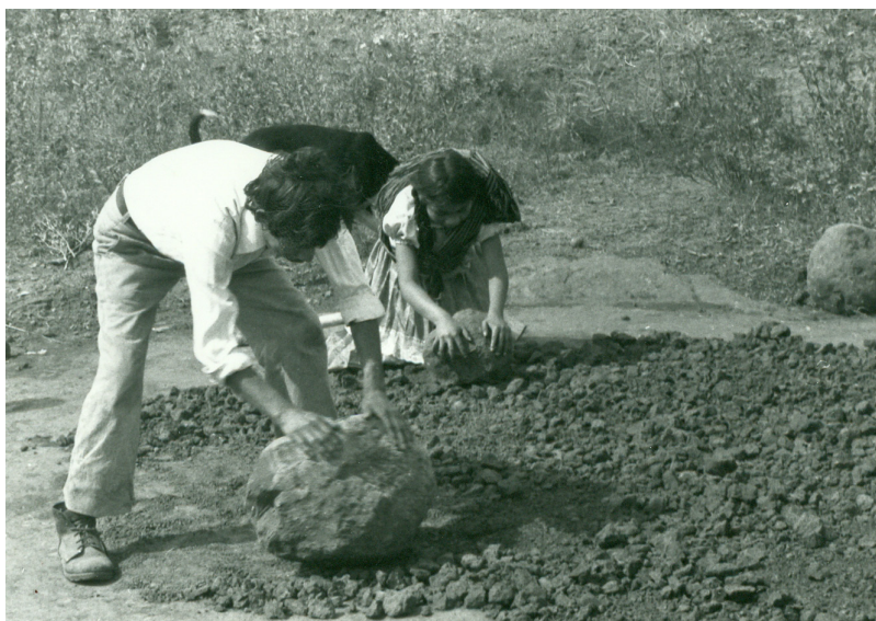
Figura 3. La arcilla era molida por los artesanos con rocas grandes, para pulverizarla y utilizarla en la elaboración de la pasta para hacer piezas de barro.