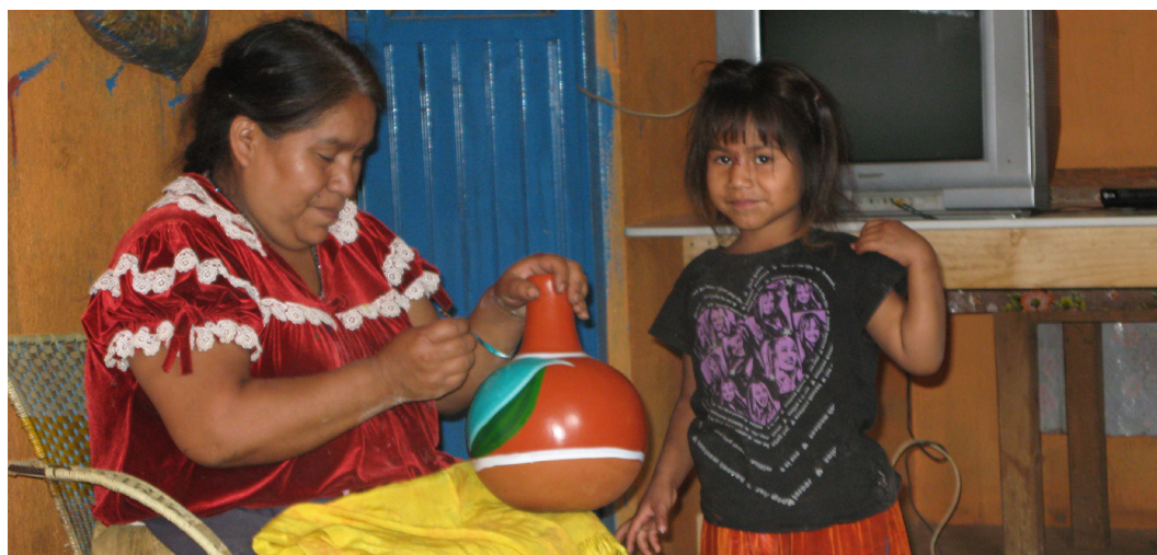
Figura 8. La constante interacción de las artesanas con sus hijas e hijos promueve el aprendizaje de la artesanía y la transmisión de un “estilo cerámico” propio de cada familia.

en la cual la producción de alfarería está orientada casi exclusivamente al comercio exterior, como es el caso de Huáncito. Según el estudio de Arnold en Ticul, la mayoría de los alfareros aprendieron la artesanía en la unidad doméstica donde viven, y su padre vive en la misma donde ellos residen. Según este autor, “un modelo patrilineal-patrilocal da cuenta de los patrones de aprendizaje de los alfareros de Ticul...” (Arnold 1989: 179).