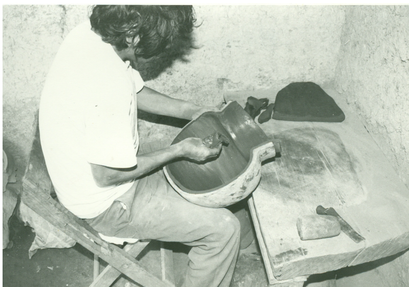
Figura 4. El cuerpo de las vasijas se forma utilizando el molde de mitades verticales.

de los moldes (Figura 4), se alisan hasta que tomen la forma del molde, después se unen, se alisa el barro por la parte interior de la vasija, se “empareja” la boca de la vasija, y después de un breve tiempo para que seque, se quitan los moldes. Una vez fuera del molde, se elimina la huella exterior de la juntura de ambas mitades, hasta que queda casi invisible. Posteriormente se pueden añadir a la vasija agarra-deras, decoraciones, vidriados, etc. Esta técnica representa un ahorro de tiempo considerable comparada con la fabricación de vasijas sin molde, haciendo manualmente el formado de la vasija, como