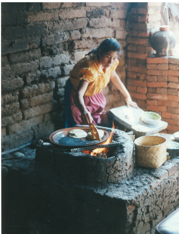
Figura 7. La leña se sigue utilizando en Huáncito y otros pueblos indígenas de Michoacán como combustible para la cocina.

de la tecnología de transporte se limitaba a cargadores con mecapal... y los recursos alternativos de energía eran muy limitados” (Sheehy 1988: 203).