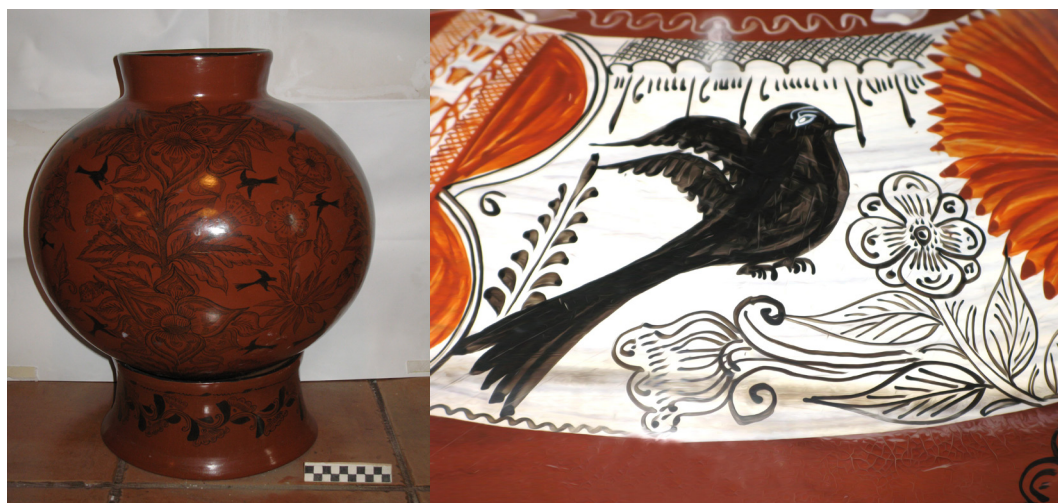
Figura 10. Detalle decorativo de una vasija elaborada en Huáncito hace aproximadamente 15 años. Contiene la representación de elementos de la naturaleza (flora y fauna), que pueden estar relacionados con la cosmovisión indígena (colección del autor).

Lackey menciona como “un rasgo cultural casi universal que los alfareros a lo