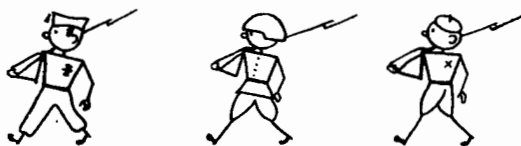
Il·lustració del llibre: Lecciones amenas . (1959).