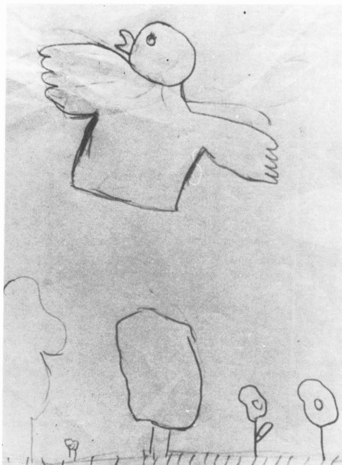
Exemple que falla la realització, perquè l'observació no és bona.

reflexió; ens deia ja a principis de segle: "Tan se val que el model sigui un guix, com que sigui un ésser vivent, com que sigui un cos mort o animat. La qüestió és que es faci a consciència dintre un mateix: és més viva una poma pintada per Paul Cezanne que una fotografia instantània d'un corredor que pren part en una carrera de Maratón".