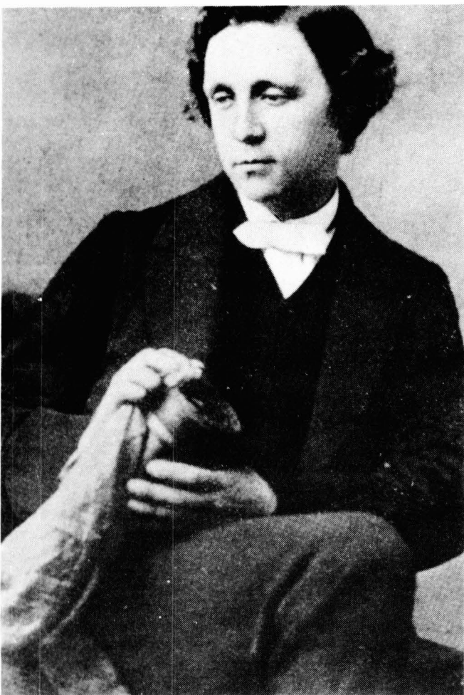
Lewis Carroll en 1863.

No voldria que s'acabàs aquest any sense que a les pàgines de MAINA, dedicàssim un record a la figura i a l'obra de Lewis Carroll.