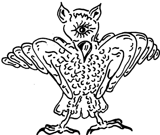
DIBUIX: JAUME FALCONER

Lo que es menos evidente —y desde ciertos círculos del saber negativo— es la relación ciencia y filosofía. La hija —dijo alguien hablando desde el positivismo— se comió a la madre. Lo científico creció tanto en su campo que agotó toda la extensión del saber: o, al menos, que tenga la categoría y valor de conocimiento.