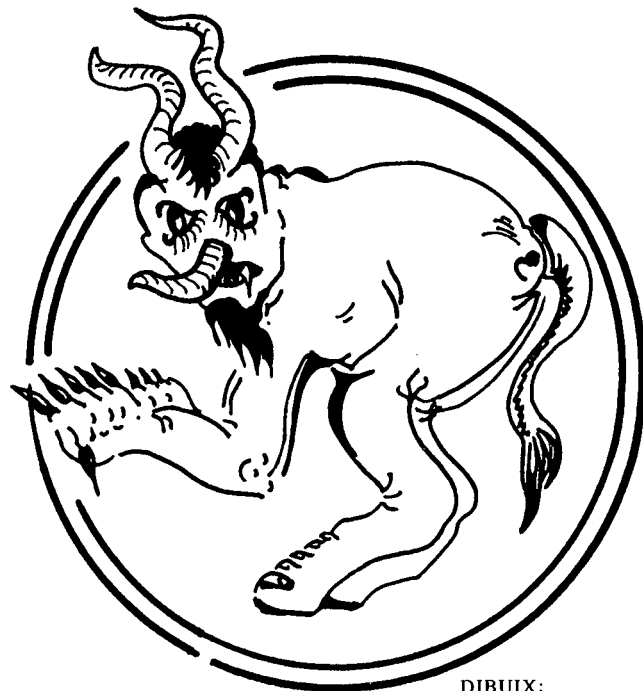
DIBUIX: JAUME FALCONER

És evident, que, dins tot això es veia que la millora de la convivència i l'avenç tecnològic afavoriria una selecció natural, més condicionada per a la culturalització de la societat i de la millora de les condicions de vida. La família més acomodada per dur a terme una vida més tranquil·la, la reducció de les malalties, afavoririen una més gran adaptació de l'espècie humana a unes condicions de vida més favorables per a subsistir i reproduir-se, per tant la selecció natural seria a poc a poc substituïda per una selecció cultural. 5 Era l'educació i l'esperança per afavorir el progrés de la societat, una societat on els homes fossin més productius uns i altres acumuladors de capital per potenciar les grans inversions. Era la nova divisió del treball que marcaria l'estructura-