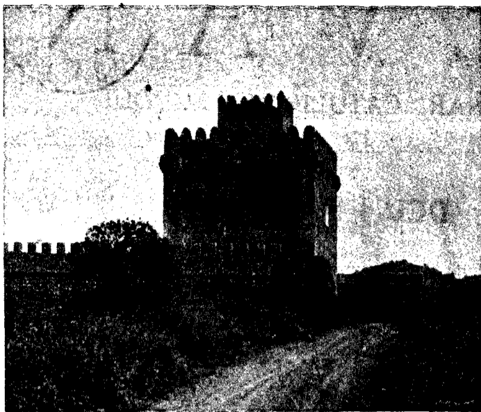
Torre de Canyamel. Antiga fortalesa gòtica. CLIXÉ-J.S anxo.

Tant se val que ho deixem córrer, doncs. Ja tornarem un altra dia, amb l'esperança de trobar la làmpara encesa.