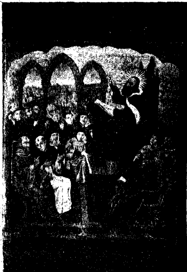
Quadret lateral del retaule que va a l. plana