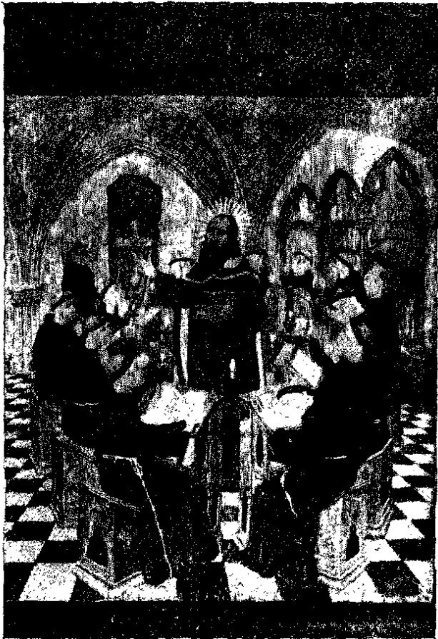
RAMON LULL EN EL COL·LEGI DE MIRAMAR