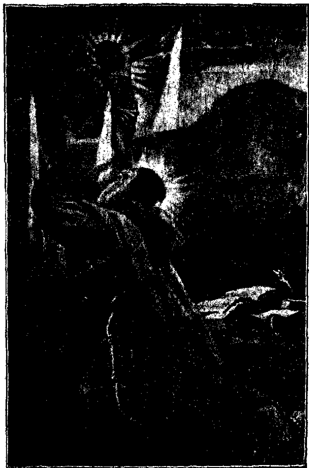
Altra quadret lateral del retaule que va a primera plana