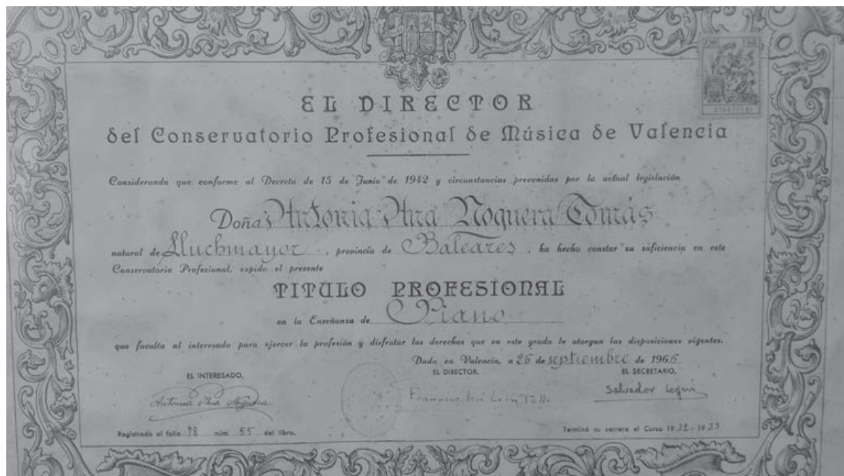
Títol professional de piano del Conservatori de València.