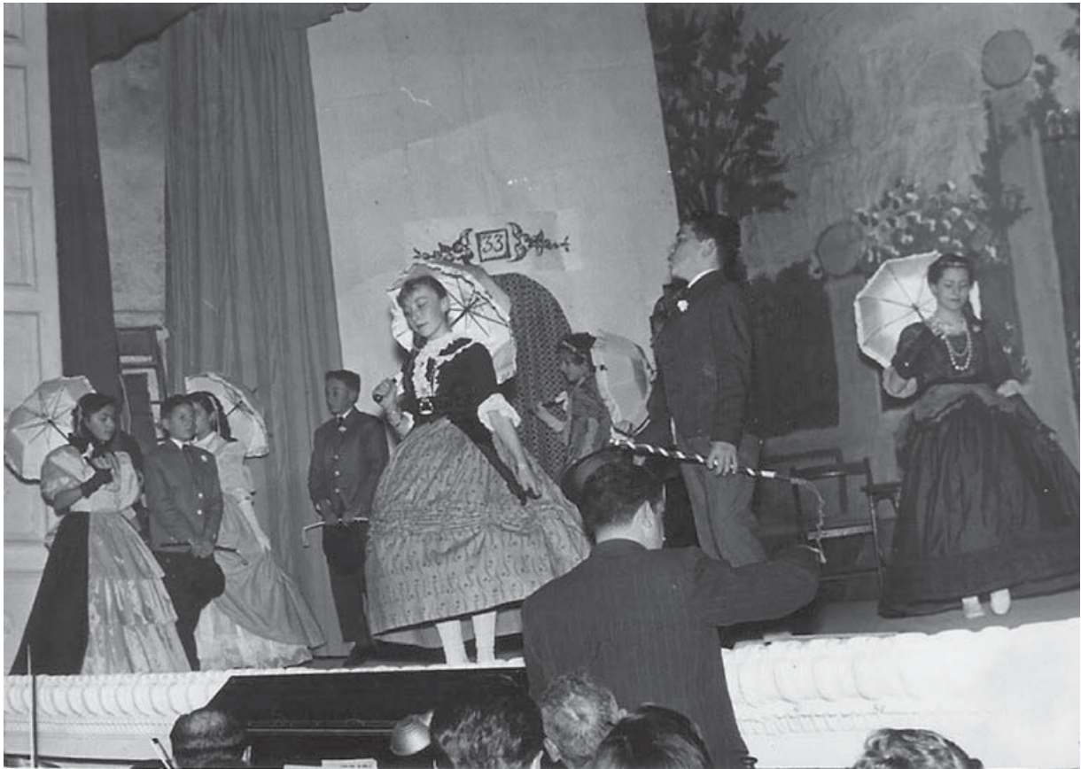
Escena de «Mazurca de las sombrillas», de la sarsuela Luisa Fernanda , interpretada per nins i nines de Lluçmajor.