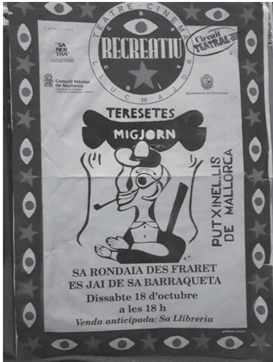
Teresetes Recreatiu, 1997