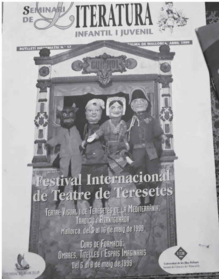
Festivalet de Teresetes.