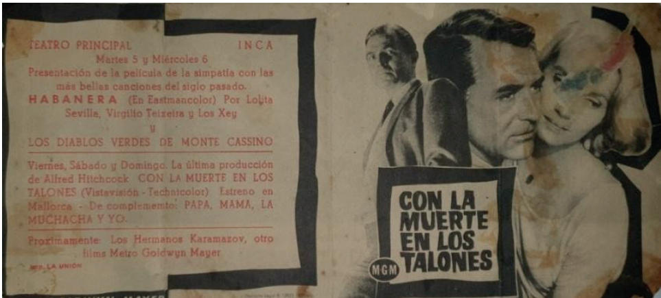
Figura 7. Programa de cine del Teatre Principal d'Inca.