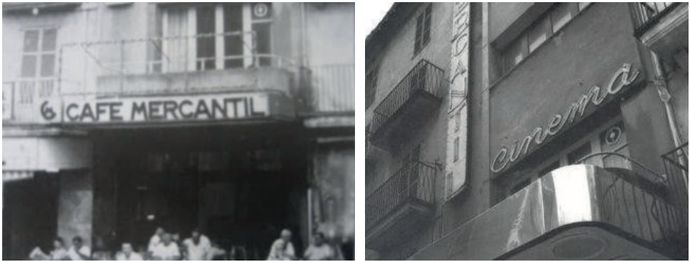
Figura 12. Fotografies antigues del Caf  Cinema Mercantil. Font: vegeu a refer ncies.

ment en venda. Amb una traject ria aproximadament de setanta-nou anys, en l'actualitat el local roman tancat en un estat de deteriorament i segueix en venda; a pesar dels rumors des de fa anys de l'inter s de l'Ajuntament d'Inca per la seva adquisici , l'espai viu immers en la incertesa d'una proposta per la seva reobertura i reforma, aix  com la seva funci  social.