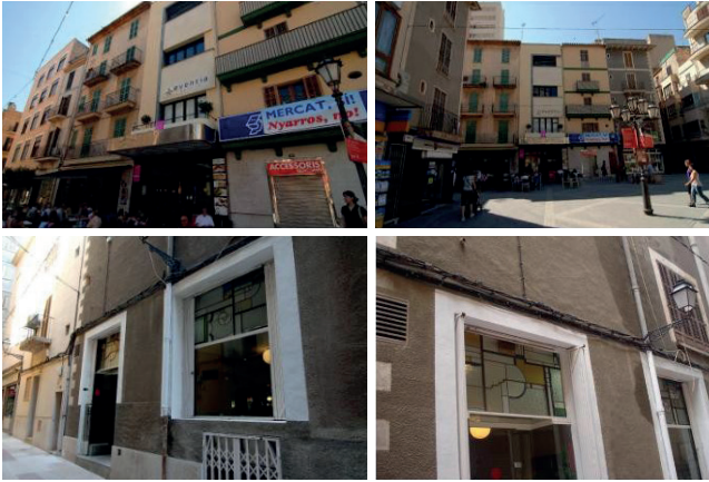
Figura 9. Fotografies de l'exterior del Cafè Cinema Mercantil.

L'edifici del Cafè Cinema Mercantil (figura 9) és una de les obres més emblemàtiques de l'arquitectura inquera. L'autoria de l'espai és obra de Francesc d'Assís Casas i Llompart 24 (arquitecte) i Francesc Serra de Can Pelat (mestre d'obres), d'estil racionalista (influint per les idees de Le Corbusier) i modernista a l'interior. S'ubica a la plaça d'Espanya en un solar on antigament hi havia un celler, el cafè Can Martínez i la Sociedad de Socorros Mutuos La Constància. Té una superfície de 375 m 2 i amb diferents zones destinades a cafeteria, sala de festes i cinema. Francesc Casas i Llompart va reformar l'interior de la planta baixa, la qual era destinada a la cafeteria, adequant l'espai que abans es dedicava a fonda i celler per a un nou espai de sala de festes. Al mateix temps, va dissenyar la nova façana seguint els esquemes racionalistes i a l'interior va aplicar el disseny del mobiliari amb alguns detalls modernistes d' art nouveau . En la dècada dels anys noranta s'hi