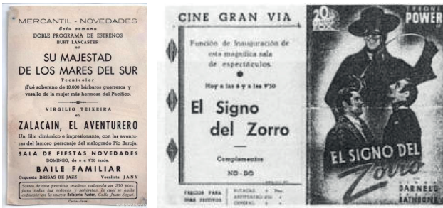
Figura 15. Programes de cine del Gran Vía o Novedades.

va fer que tanqués el desembre del 2003, i deixà orfe el municipi d'Inca de sales de cinema durant molt temps, i el 17 d'abril de 2007 es va enderrocar l'edifici (figura 13).