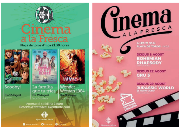
Figura 16. Programes de cinema a la fresca a la plaça de toros (2021).

D'altra banda, es varen desenvolupar sessions i projeccions de pel·lícules a l'aire lliure a partir de 1944 en el camp de futbol des Cos, conegut inicialment com les Delícies Camp es Cos (actualment conegut com el Camp Nou d'Inca o Nou Camp d'Inca des del 1986, on juga el Club Esportiu Constància, amb una capacitat de 10.000 espectadors) i que va deixar de fer-ho, en primer lloc, l'any 1948 i posteriorment després de recuperar-se l'any 1952. Per sort, tal com