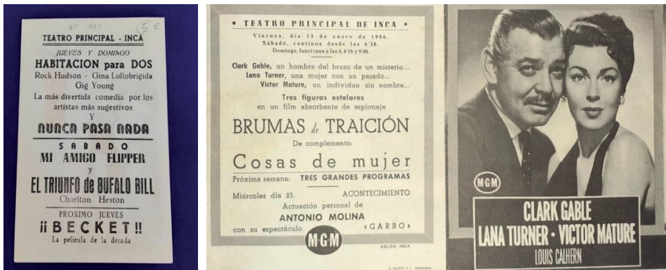
Figura 5. Programes de cine del Teatre Principal d'Inca.

llores que varen afavorir la qualitat de l'experiència i del local equiparant-lo als millors de l'illa (Sbert i Barceló, 1998).