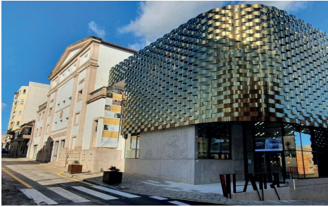
Figura 1. Façana exterior del Teatre Principal d'Inca en l'actualitat.