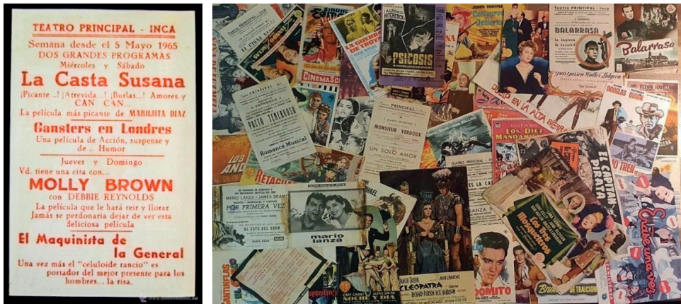
Figura 4. Programes de cine del Teatre Principal d'Inca.