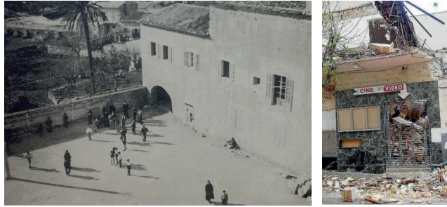
Figura 13. Visió panoràmica del pati del Col·legi Beat Ramon Llull, on s'observen els horts actualment ocupats per la Gran Via de Colom i on s'ubicà el cinema Novedades. La imatge de la dreta mostra el dia de l'enderrocament del cinema Novedades, iniciat el 17 d'abril de 2007.