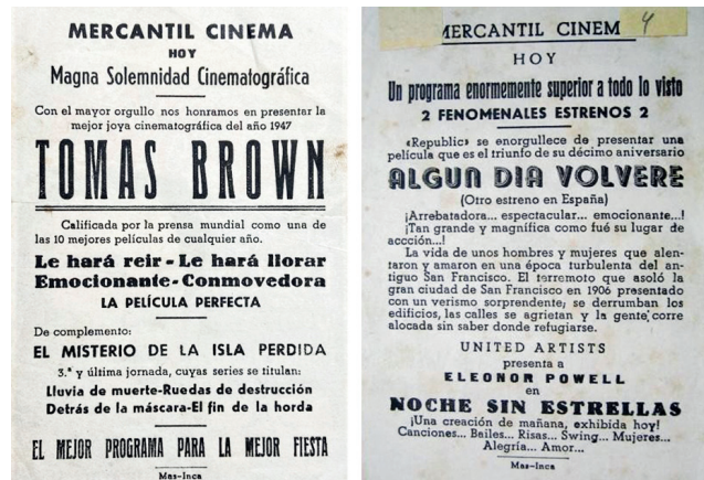
Figura 11. Programes de cine del Cafè Cinema Mercantil.

Pel que fa a l'espai d'exhibició de pel·lícules, l'aparellador municipal Jaume Roig va aprovar la construcció del cinema en el primer pis de la finca, a través d'una instància presentada a l'Ajuntament d'Inca el 31 de maig de 1935. Aquest s'ubicava a la part superior del bar amb una estructura sense pilars amb materials de bona qualitat (ferro, pòrtland, ciment), no sense dificultats per obtenir-los. El Cafè Mercantil (figura 12) va ser inaugurat i va obrir les portes al públic el 8 de febrer de 1936, però no fou fins a l'any 1940 quan es varen començar a projectar les primeres pel·lícules (figura 11) al local, cosa que durà fins aproximadament l'any 1984, quan deixà de projectar pel·lícules i abandonà la seva funció cinematogràfica. No obstant això, però, el local va continuar obert com a cafeteria fins a l'any 2014, quan va tancar definitivament les portes com a comerç al públic. L'empresari turístic i polític inquer Miquel Ramis va decidir no renovar el contracte al darrer explotador, Pedro Mas, i va posar l'establiment