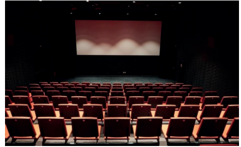
Figura 2. Sala annexa del Teatre Principal d'Inca.