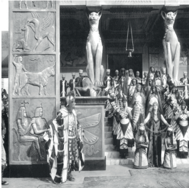
Figura 3. Cartell i escena de la pel·lícula Cabiria (Giovanni Pastrone, 1914).

varen fer projeccions cinematogràfiques perquè, tal com s'ha esmentat anteriorment, es va comprar un projector de la marca Gaumont 21 i la primera pel·lícula que s'hi va projectar va ser el pèplum de Giovanni Pastrone Cabiria (figura 3), amb una primera sessió el 3 d'abril del 1915.