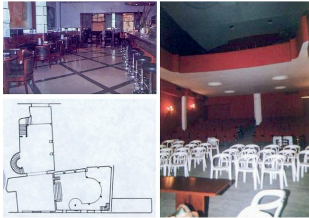
Figura 10. Fotografies de l'interior i de la planta del Cafè Cinema Mercantil.

A l'interior (figura 10), la planta baixa està ocupada per la zona del cafè i de sala de ball, a la dreta hi ha la barra del bar i, a prop, una escala corba, molt característica de les obres de Casas i Llorpart, la qual dona accés als pisos superiors i als serveis. Hi destaquen els pilars de vidre i fusta, i la part superior del portal i la finestra del carrer del Peix fetes amb peces de vidre de diferents colors, les vidrieres fetes a Can Guardiola, vitralls característics de l'Escola Alemanya, que estan unides mitjançant plom i que deixen lliure l'accés a la llum exterior. El mobiliari fou adquirit a Muebles Llabrés i Muebles Vda. d'Oliver.