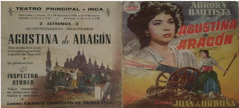
Figura 6. Programa de cine del Teatre Principal d'Inca.