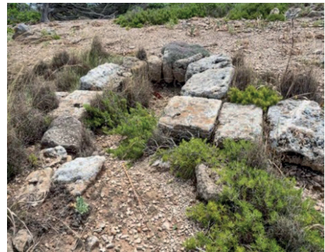
Figura 3. Plànol de la Mesquita de Sani'tja (es Mercadal, Menorca). Planta: 1= qibla / mur sud - 2 = mihrāb – nínxol de la qibla - 3 = haram = pati. Foto: detall del mihrāb . Font: reelaboració a partir de KIRCHNER, 1999.